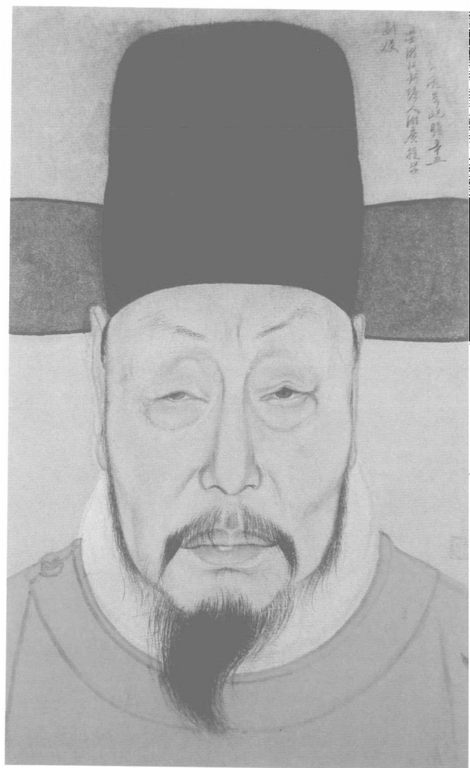
明人绘李日华肖像