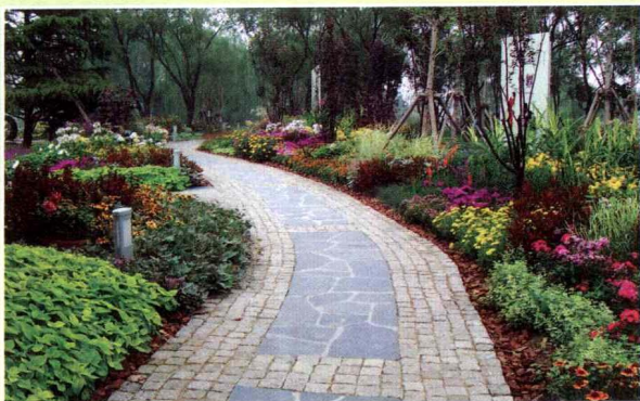
14. 公园花卉展步道两旁的自然式花境，模拟野生花卉地被，沿路形成色彩丰富的片状花卉植物景观