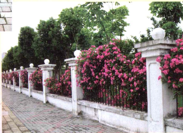
12. 爬满盛开蔷薇的栅栏