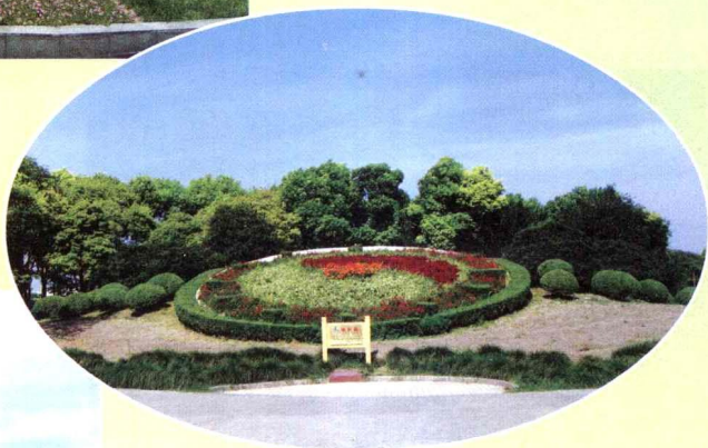
10. 节点处规则式主题花坛，场地用黄杨球勾出边界，中间是绿篱和花卉组成的钟表花坛