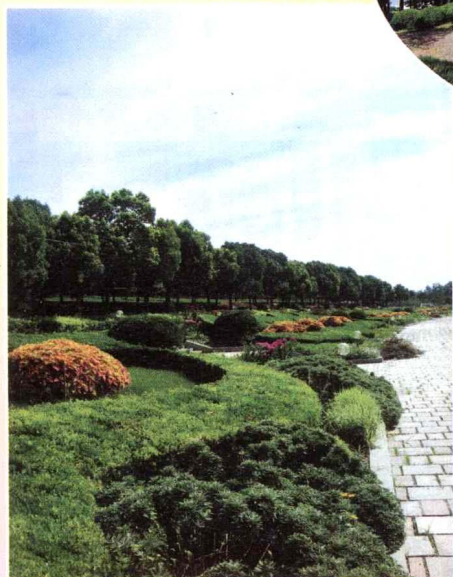
11. 景观道一旁混合式绿地，前景以整形绿篱作为景观主导线条，灌木与花卉地被顺应栽植，背景是整齐的行道树，作为道路视线边界