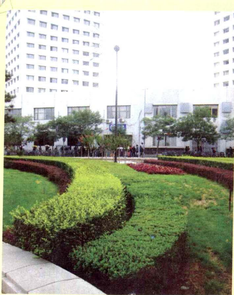
17. 黄杨、紫叶小檗、金叶女贞修剪成的模纹