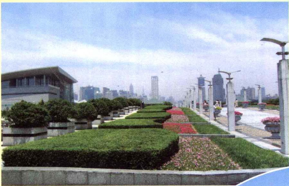
9. 主景观道两旁对称式绿带（示其一側），规则式模纹花坛，种植整形的地被与绿篱