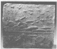
（东汉）收获渔猎画像砖