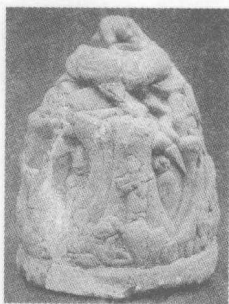
(东汉)摇钱树座石刻

东汉安帝(107—126)在位十九年中,大的农民起义一共发生了四次,顺帝(126—144)在位十八年中,大的农民起义一共发生了十次,冲质两帝一共在位不满二年,大的农民起义却发生了七次,桓帝(146—167)在位二十一年中,大的农民起义一共发生了十四次,灵帝(168—189)即位后一直到公元180年,农民起义一共发生了六次。以上还不过是有史可稽的,至于规模较小史书失载的农民起义,次数就难以计数,参加起义的人数也愈来愈多。在安帝顺帝时代,起义军不过几千人,到了桓帝灵帝时代,就多达数万人,甚至十余万人了。到了灵帝中平元年(184)以后,便总爆发了全国性的黄巾农民大起义。东汉末,农民起义地区,不仅在中原,西及益州,南至交趾。又从黄巾起义中分裂出无数细流,如黑山起义军、白波起义军等。而青州、徐州黄巾起义军,众过百万,