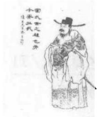
曹操在赤壁之战中，大败周瑜，统一南方。