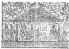
(东汉)纺织画像石(拓片)