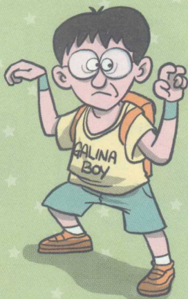
眼仔(汉堡包终结者)