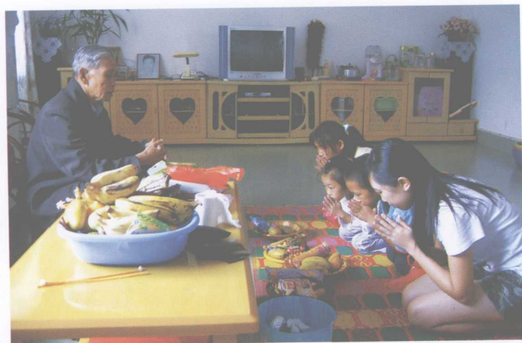
关门节时，孩子们正在向长辈“苏玛”（祝福，请教）