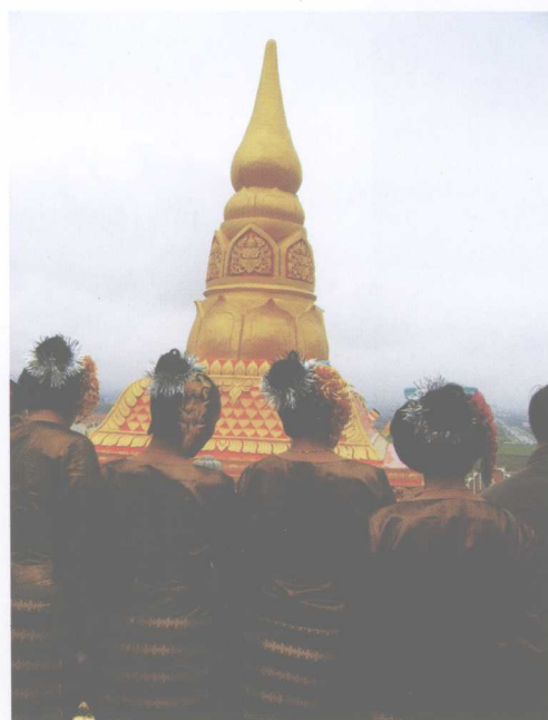
勐泐大佛寺开光时着盛装的傣族妇女们