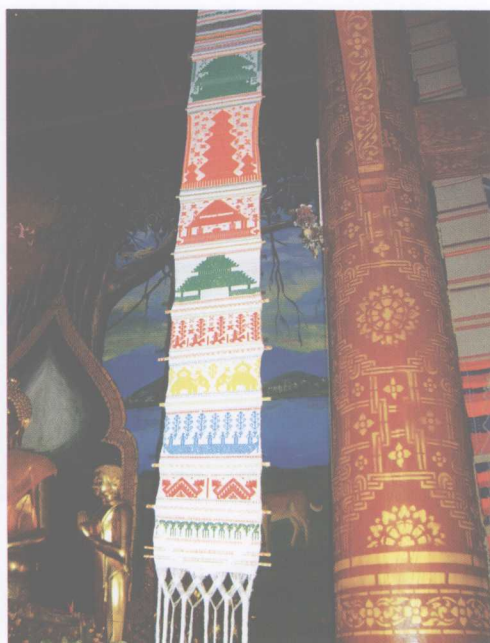
色彩斑斓的傣族手工幡锦