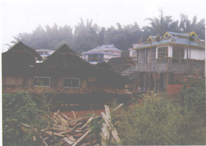
正在新建中的第四代傣家民居