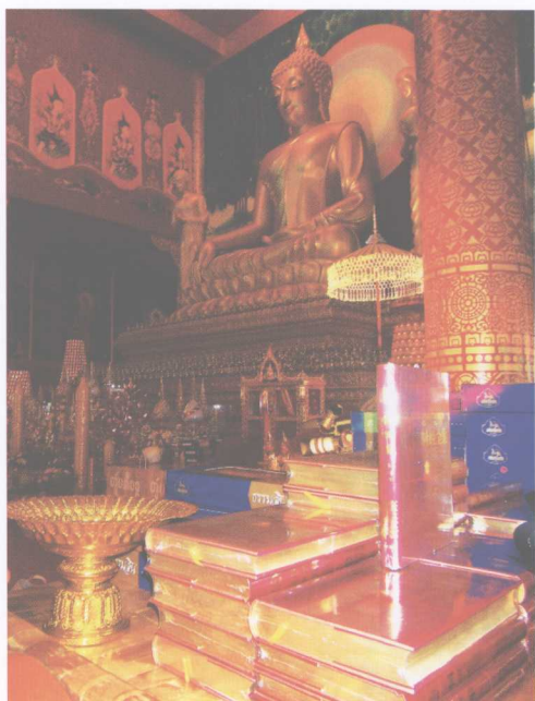
新落成的勐泐大佛寺