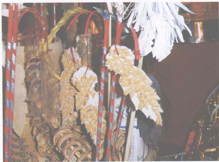
百姓赍到佛寺中献给“牙欢豪”（谷魂奶奶）的谷穗，祈盼风调雨顺，五谷丰登