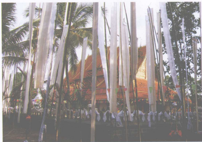
关门节时佛寺大殿外的佛幡