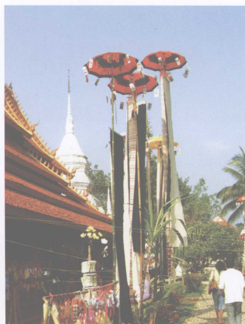
开门节时橄榄坝曼听佛寺的赓品