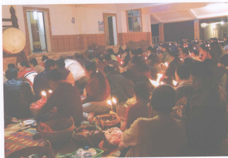
勐海总佛寺关门节时的滴水仪式