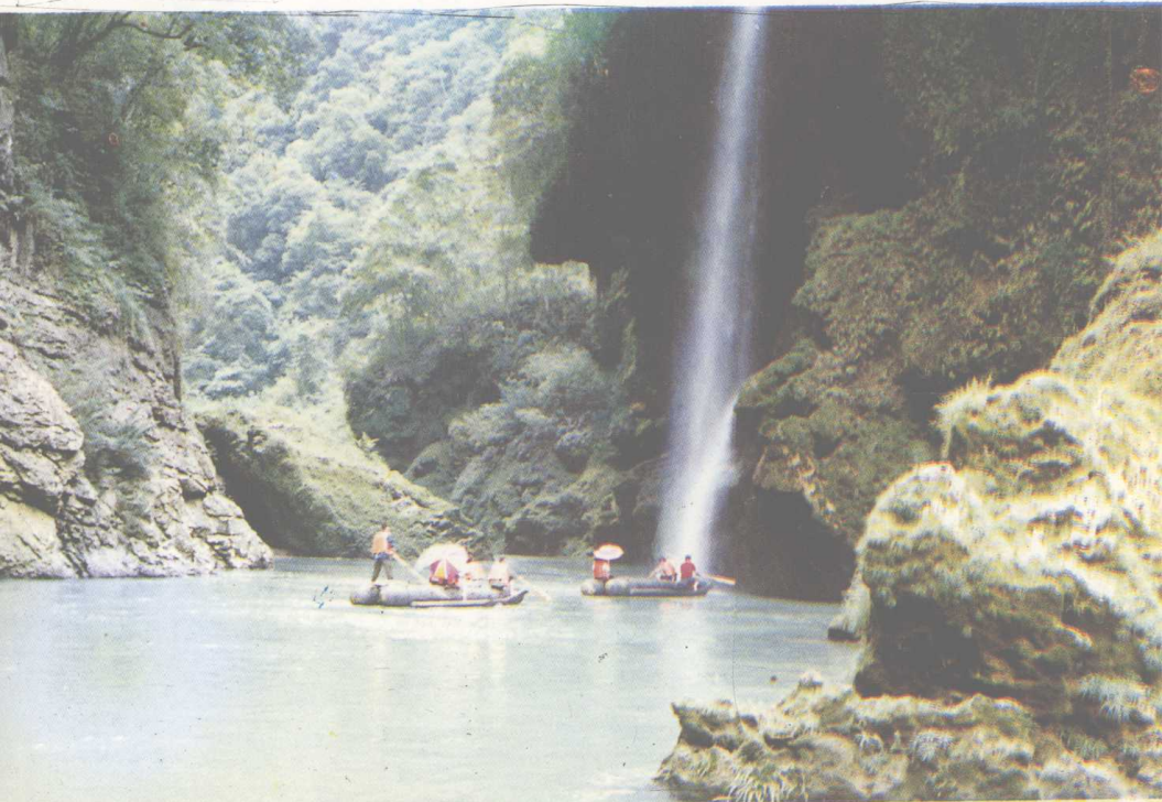
猛洞河景点——遇仙峡