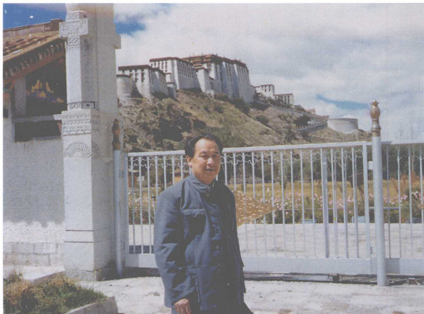
在拉萨布达拉宫前（1985年）