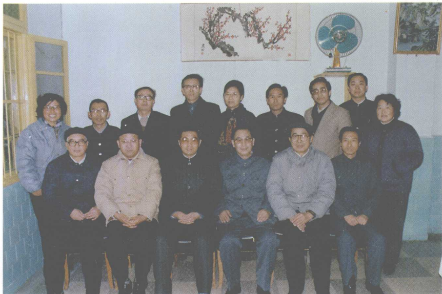
胡锦涛接见《当代中国的西藏》编辑部部分成员（1988年于成都）