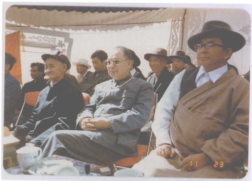
在西藏社会科学院成立大会上（1985年9月）