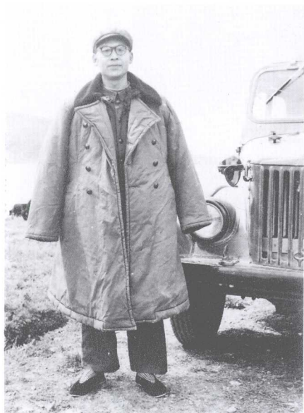
采访中印边界自卫反击战后，从亚东前线归来，摄于羊卓雍湖畔 (1965年)