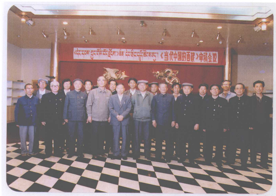
《当代中国的西藏》审稿会合影（右二为作者，1989年于成都）