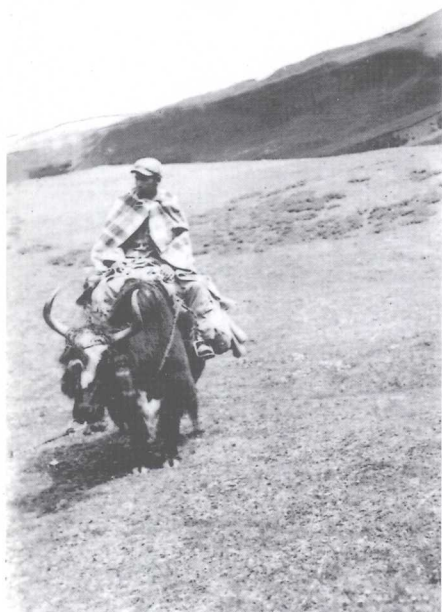
越过海拔6000多米的卓莫里拉大雪山外出采访（1953年6月）