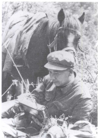
骑马采访西藏边防部队途中休息 (1965年)