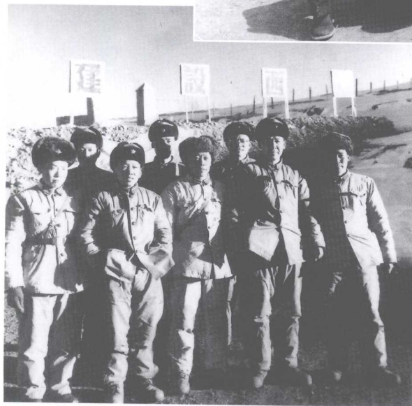
在海拔5300米的查果拉山顶与“红色边防队”指战员合影 (右二为作者, 1965年春节前)