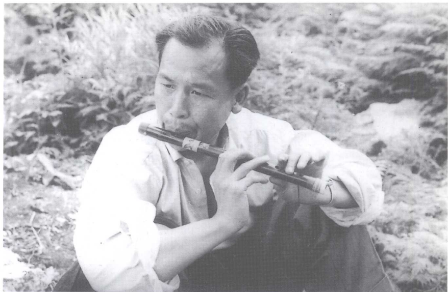
在“西藏江南”察隅采访途中休息 (1965年)