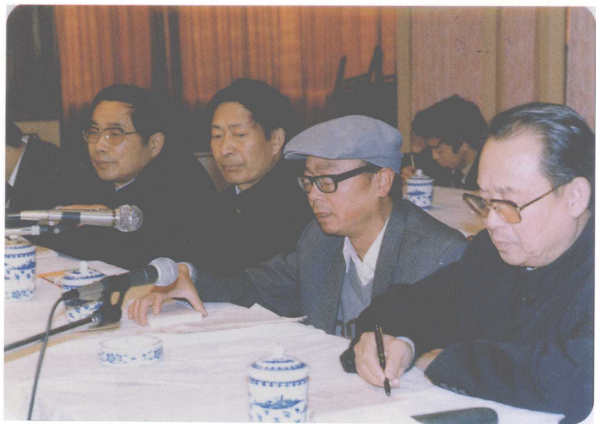
在《当代中国的西藏》审稿会上（右一为作者 1989年于成都）