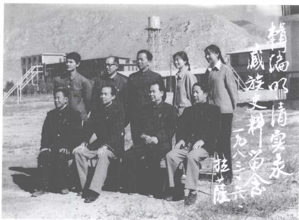
与明、清实录藏族史料编辑部成员合影 (1983年6月)