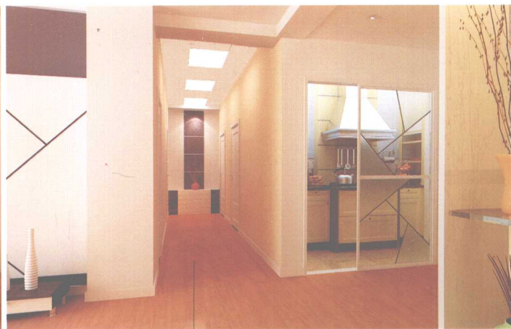
— 木质地板 —