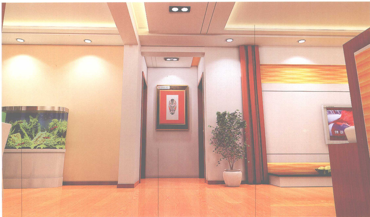
— 水族箱 —