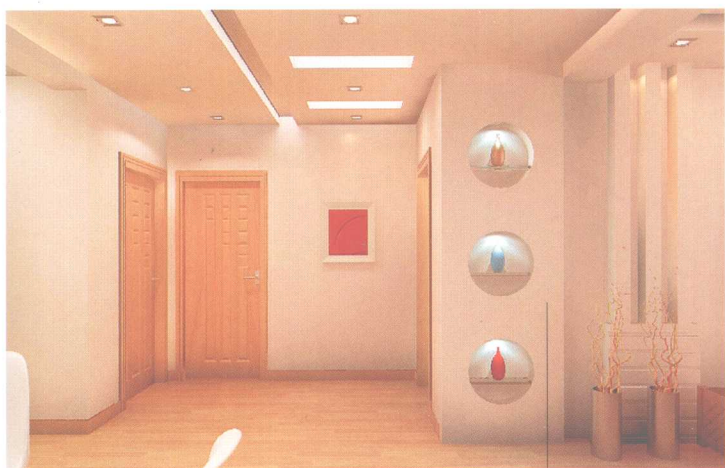
— 石膏板造型 —