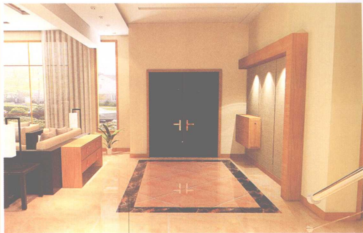
— 地砖拼花 —