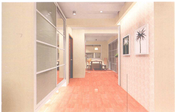
— 壁纸 —