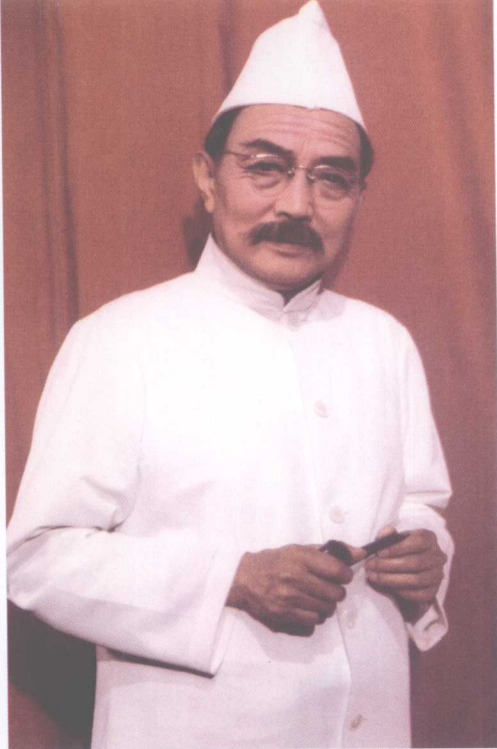
1983年在《断线风筝》 中饰谢格拉特教授