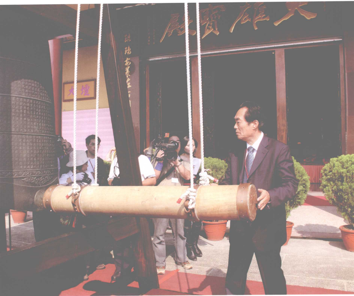
和合钟声和谐音（2008年12月，佛光大雄宝殿前）