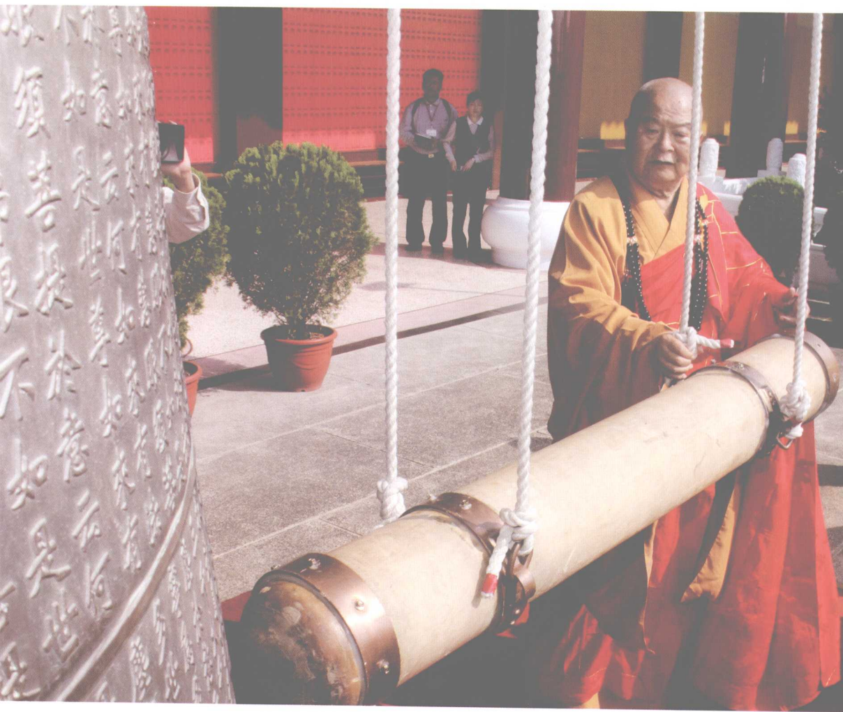
兄弟和合钟相连（2008年12月，佛光大雄宝殿前）