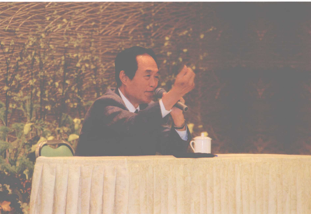
在佛光山丛林学院为师生讲清史