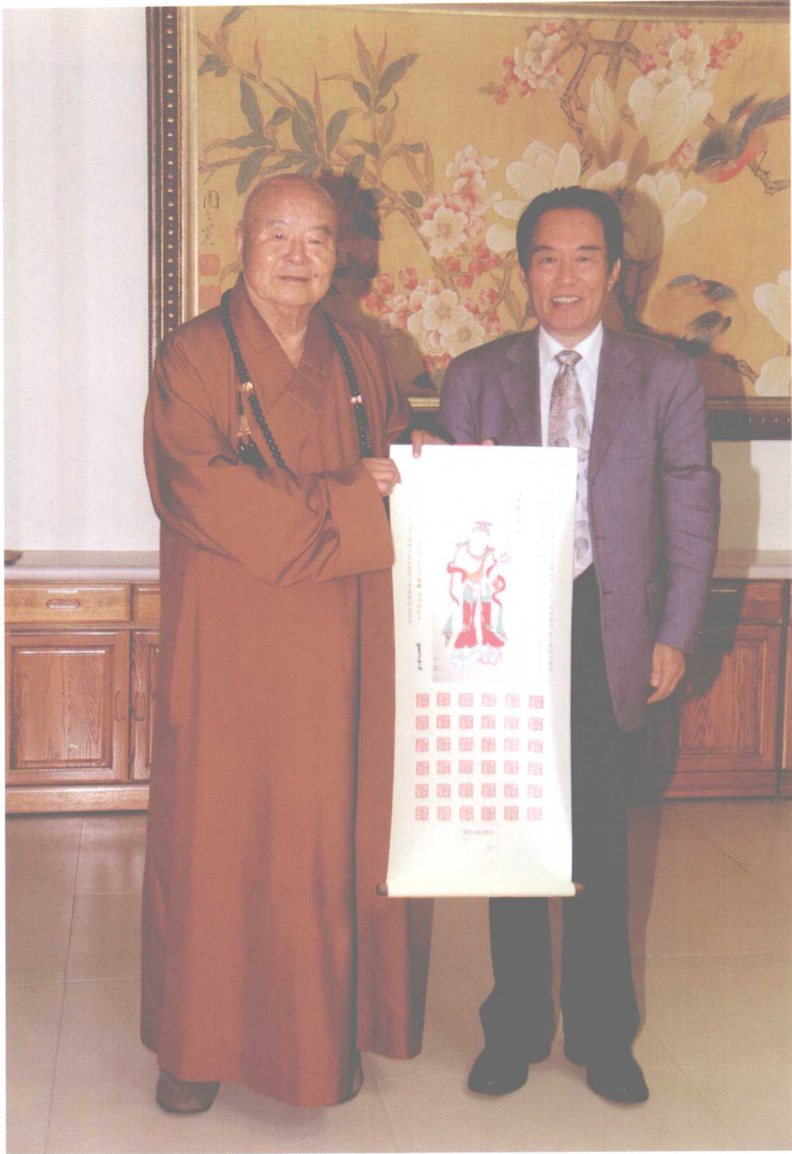
星云大师向崇年先生赠送张大千观音画 (2008年11月，佛光山传灯楼法堂)