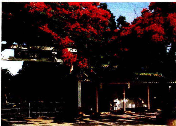
(深圳东湖公园二号门)