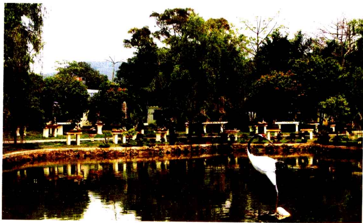
（深圳东湖公园盆景世界一角）