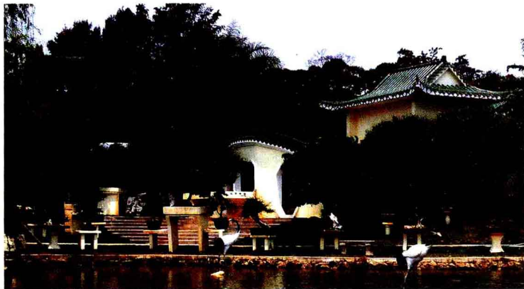
(深圳东湖公园盆景世界)

全书分文字和作品图片两部分。文字部分详细介绍了树石盆景的艺术表现、分类方法、造型形式、常用材料，以及加工制作方法和养护管理，并选用彩色图片配以文字着重介绍了水旱类、全旱类等五种造型形式的加工制作实例，以帮助盆景初学者入门制作与提高；图片部分精选了深圳东湖公园盆景世界的各种造型形式和艺术风格的树石盆景图片100多幅，并对其中佳作作简短的文字赏析，以帮助读者领略树石盆景的艺术魅力。