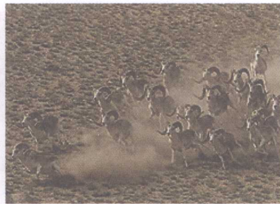
帕米尔高原上的马可·波罗羊