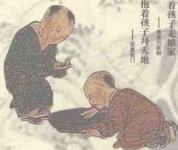
——歇后语：白刀子进，红刀子出