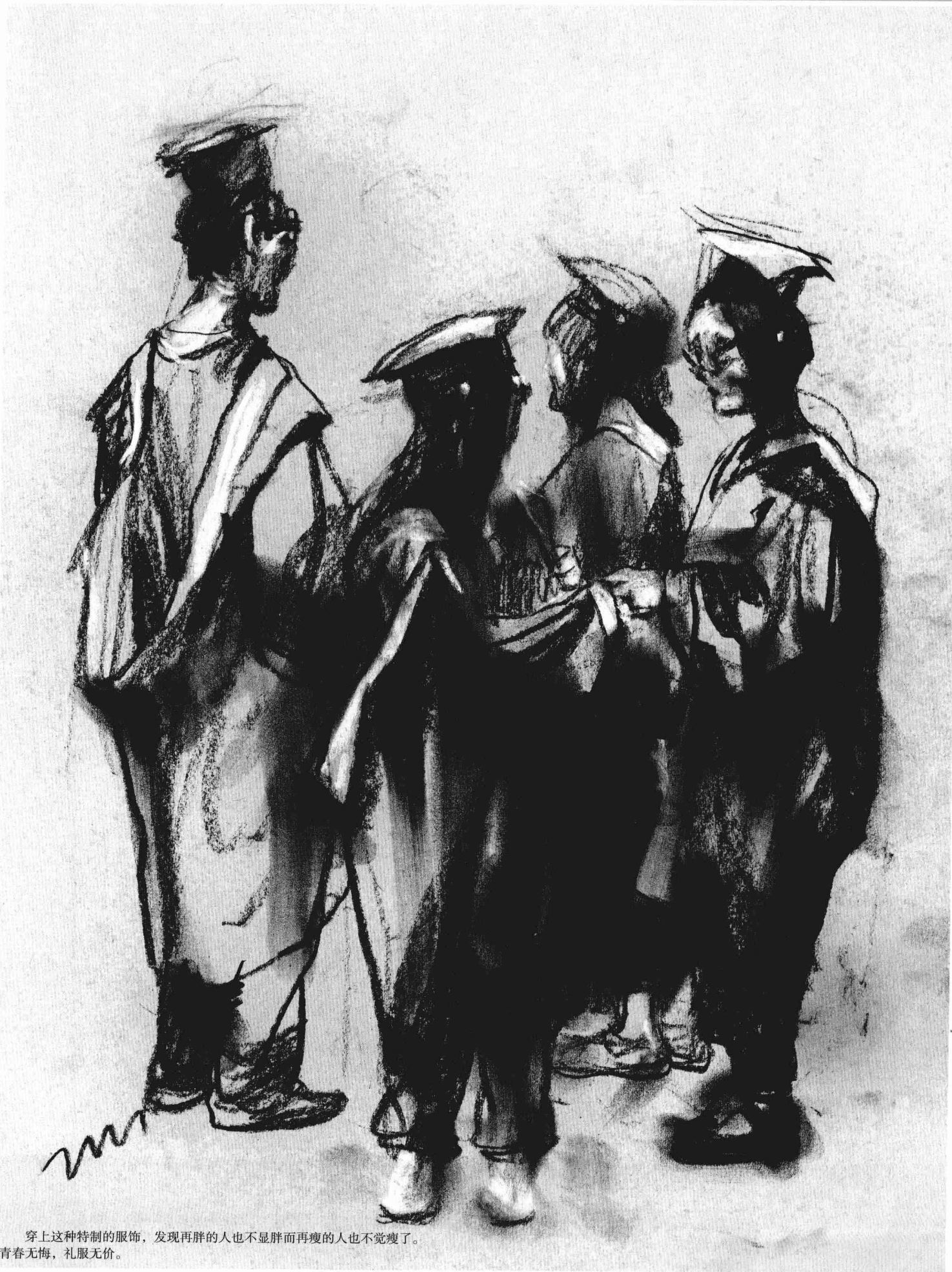
穿上这种特制的服饰，发现再胖的人也不显胖而再瘦的人也不觉瘦了。 青春无悔，礼服无价。