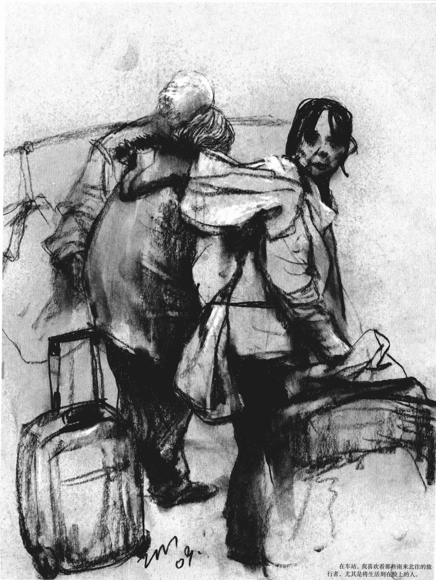
在车站，我喜欢看那些南来北往的旅行者，尤其是将生活刻在脸上的人。