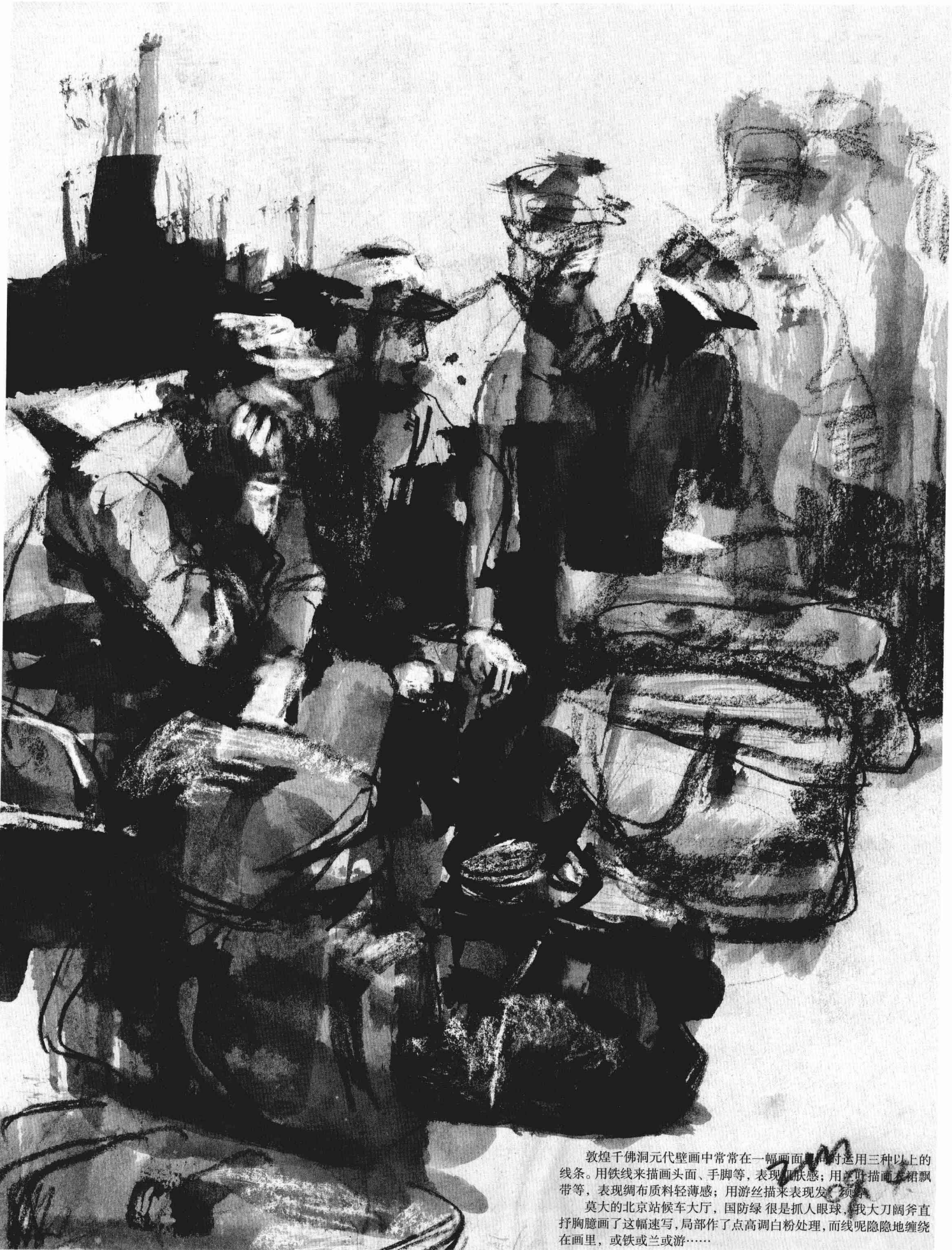
敦煌千佛洞元代壁画中常常在一幅画面里同时运用三种以上的线条。用铁线来描画头面、手脚等，表现肌肤感；用游丝描画衣裙飘带等，表现绸布质料轻薄感；用游丝描来表现发、须等。 莫大的北京站候车大厅，国防绿很是抓人眼球，我大刀阔斧直抒胸臆画了这幅速写，局部作了点高调白粉处理，而线呢隐隐地缠绕在画里，或铁或兰或游……