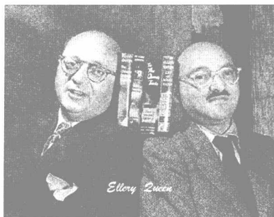
埃勒里·奎因 Ellery Queen