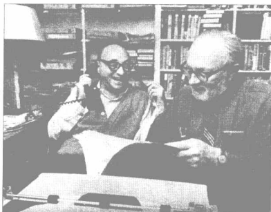
巴纳比·罗斯 Barnaby Ross ——埃勒里·奎因的面具

埃勒里·奎因的“悲剧系列”是全世界水平最高的系列推理小说之一。这四幕“悲剧”的精彩不仅仅限于故事本身，台前幕后的花絮时至今日依然是读者津津乐道的话题。