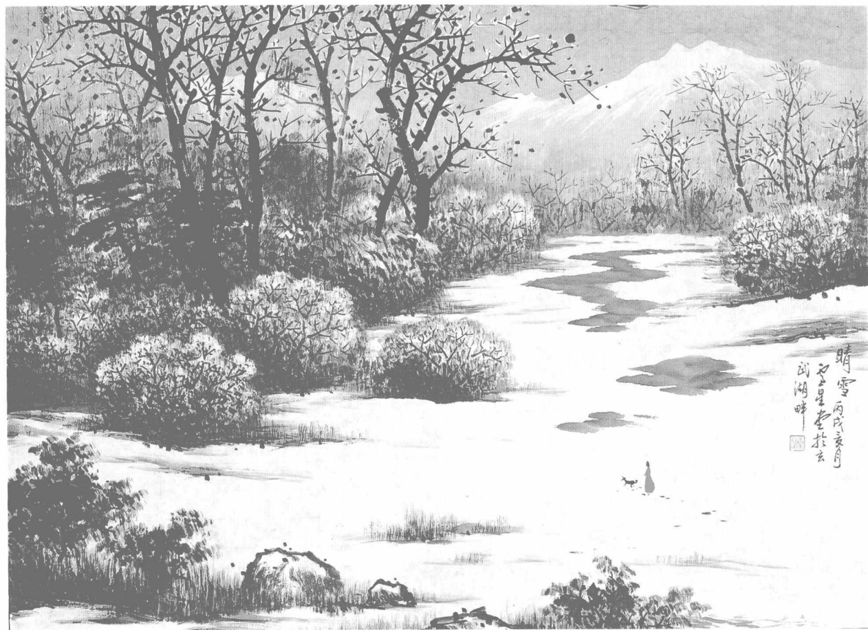
卢星堂先生笛意画作《晴雪》