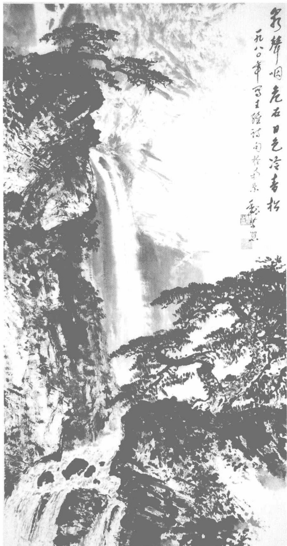
著名画家魏紫熙先生笛意画作《泉声咽危石》