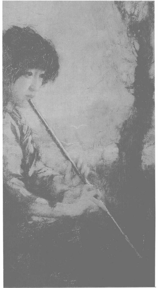
油画《箫声》(徐悲鸿作)