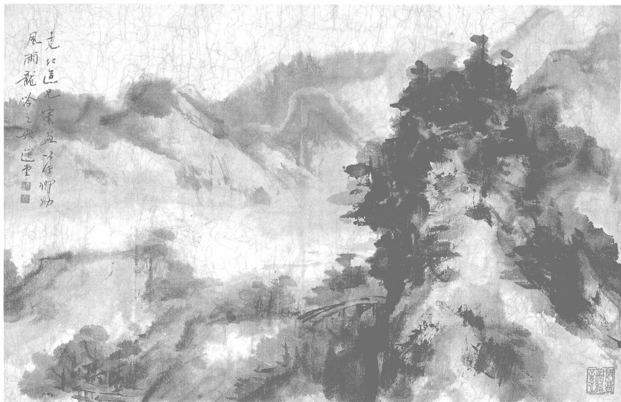
饶宗颐(选堂)先生作《风雨龙吟之兴》画赠林克仁