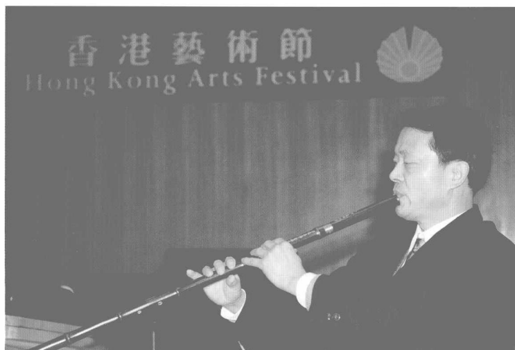
林克仁出席香港艺术节(1999年2月)