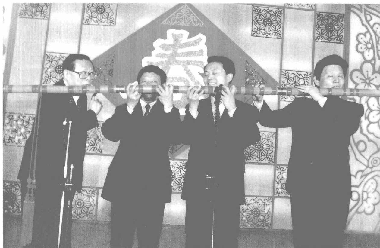
1998年，中共中央元宵节晚会上江泽民同志在观看巨笛演奏 (右一：蒋国基，右二：林克仁，右三：常敦明)