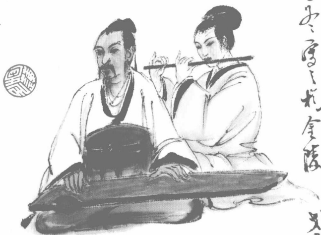
著名书画家、鉴定家萧平先生简意画作《古韵悠悠千载传》