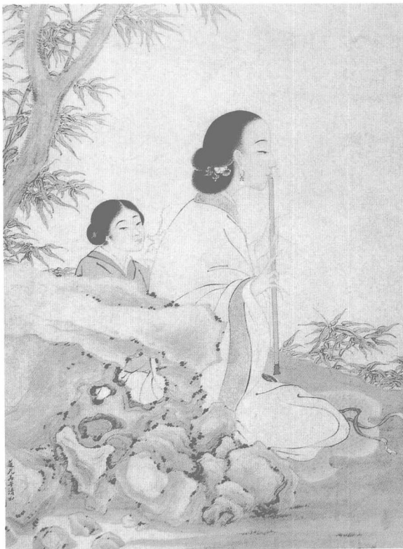
《月下吹箫图》(清·费丹旭作)