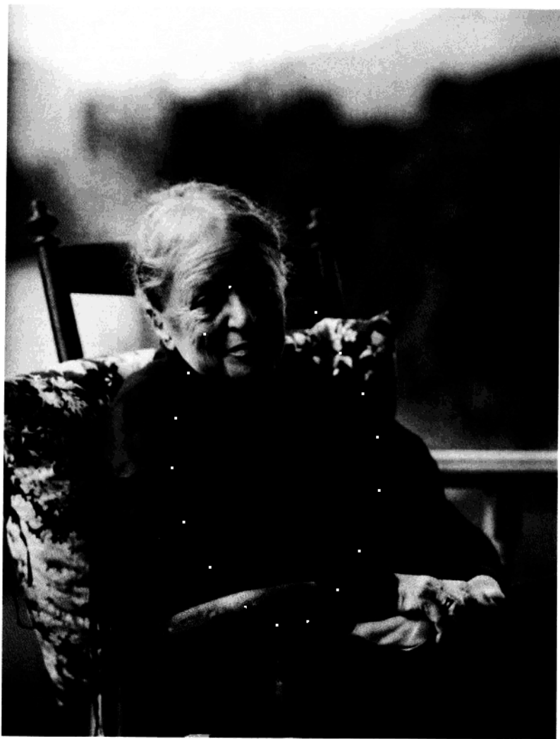
海德韦格·史戴利夫人 1920