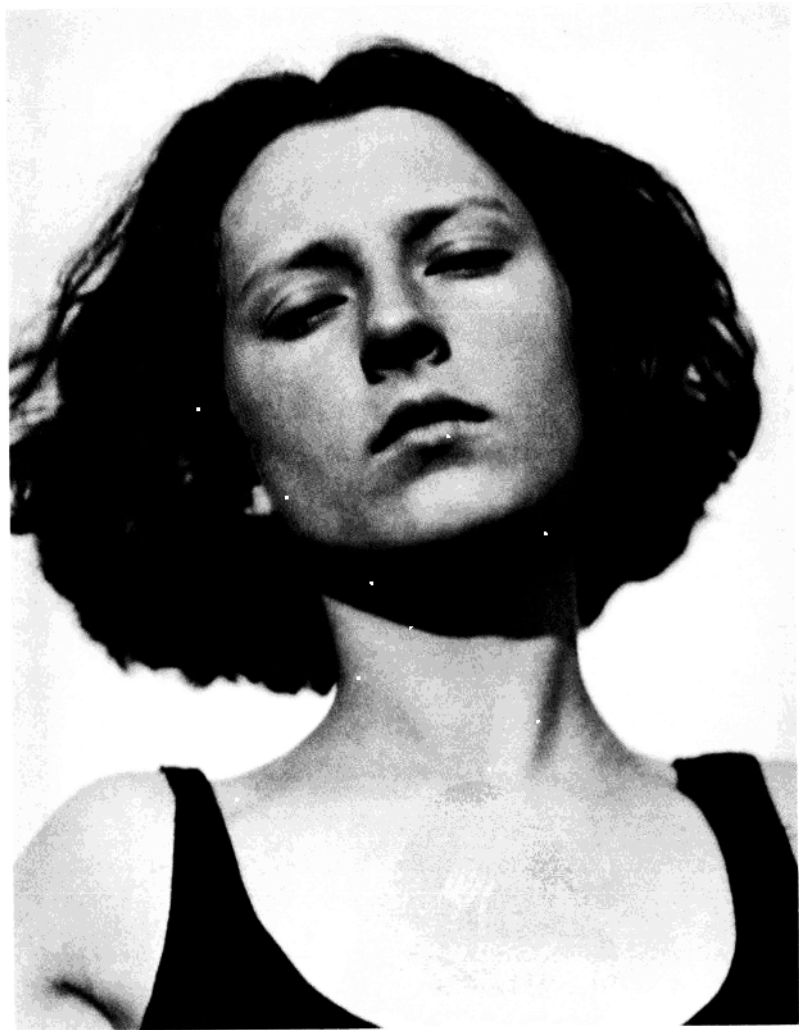
玛格丽特·特雷德维尔 1921