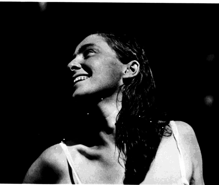
丽贝卡·塞尔思贝利 1923