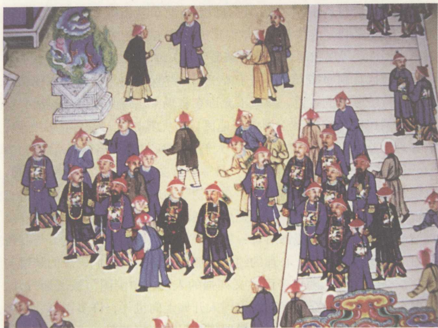
清代文武官员服饰总体呈现和谐统一特点

司有此类职责；兵部名义上是全国最高军事机关，吏部名义上是全国官吏选拔和任免机关，但实际上兵部、吏部此方面的职权却较小，全国军务的控制权、全国高官的任免权以及调度权，实际都掌握在军机处手中；刑部按理应掌管全国刑法案件，但由于建有都察院、大理寺等专职机关，其司法职能也被大大削弱。