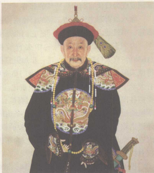
清代官制服饰中最具特色的顶戴花翎、披肩领、箭袖及补服、朝珠

清太祖努尔哈赤在开国之初，建立起军政合一的八旗制度，将全体女真人归入八旗统一管辖，“出则为兵，入则为民”，大大增强了全民族的总体实力。当时，女真人按黄、白、红、蓝和镶黄、镶白、镶红、镶蓝八种旗帜进行编户，每旗辖7500人，八旗首领（固山）之下设置甲喇、牛录等官员，大小官员均由女真贵族担任。至清太宗皇太极执政后，又仿照满洲八旗陆续建立蒙古八旗和汉军八旗。为更好治理八旗，清入关后，朝廷专门设有八旗都统衙门，分管本旗军民事务。清代八旗制度一直沿袭到清朝末叶，所有在旗的旗人均享受国家给予的特权，无论是政治地位还是物质待遇都高于普通百姓，文、武官职一身兼任的八旗属官，其在官制中的地位也远高于同级的官员，使八