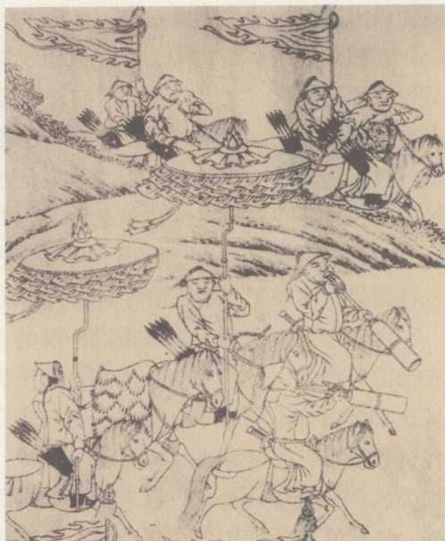
努尔哈赤统兵进范河界图。八旗官员服装已带有明式补子图案

清朝入关前，满族人既是国家的主宰，也是构成国民主体的成员，大清的主要成员基本由满族人构成，那些在战争中掠获