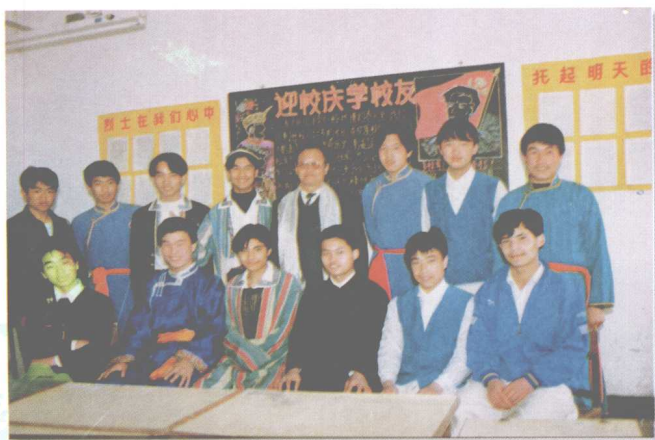
1994年4月4日，赛希同中央民族大学附中“多松年班”（第一期）同学合影