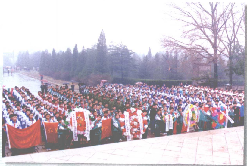
张家口市少先队员举行“筑起我们新的长城”大型继承革命先烈遗志活动