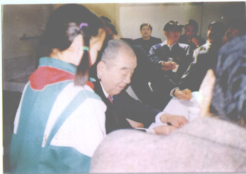
原全国人大常委会副委员长布赫为“多松年中队”题写队名