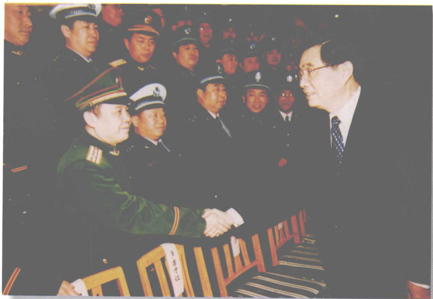
胡锦涛总书记接见武警和公安干警时， 同多松年孙子云国华亲切握手