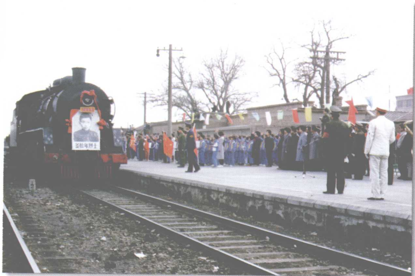
1992年3月29日，张家口市党政军领导及各界群众、少先队员举行欢迎仪式，迎接呼和浩特市赠送的多松年烈士铜像