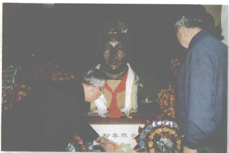
赛希、乌嫩齐向多松年烈士敬献花篮