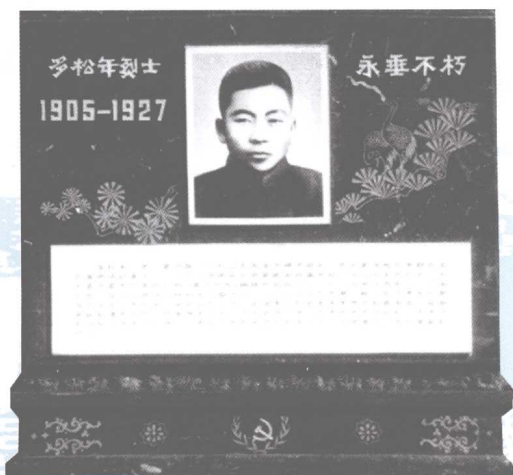
在内蒙古革命烈士陵园中 存放的多松年烈士骨灰盒