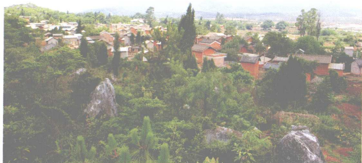
坐落在山林之中的蓑衣山新寨