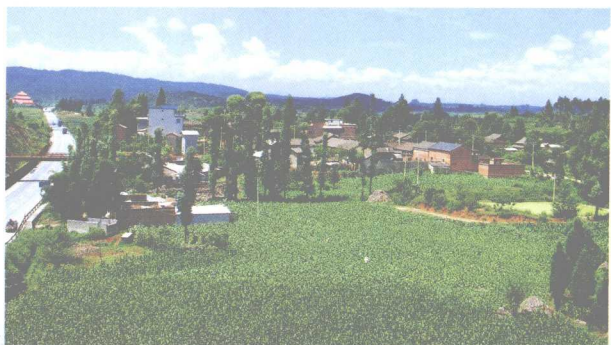
坐落在昆那、昆河公路之间的蓑衣山塘上