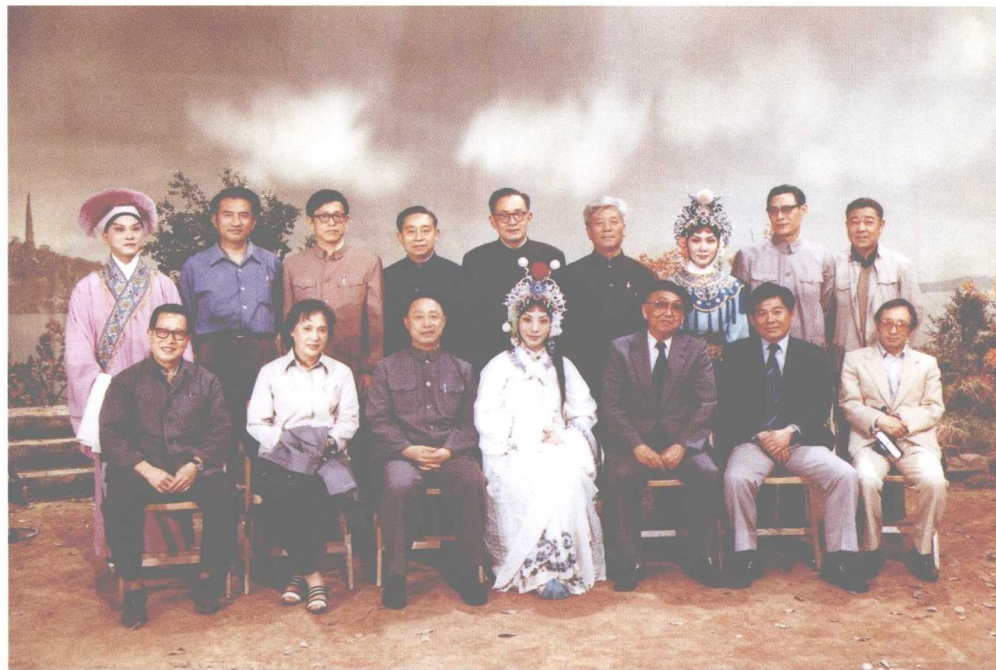
1980年，日本导演山本萨夫参观《白蛇传》拍摄现场，前排左一至左五：黄绍芬、秦怡、徐桑楚、李炳淑、山本萨夫；后排左二杨在葆、左四桑弧、右二刘琼