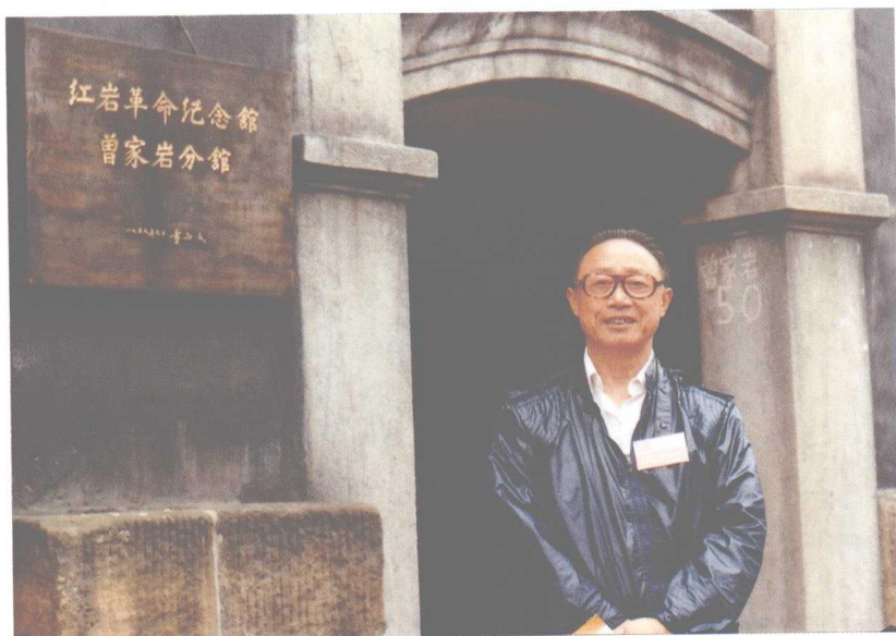
40年后重返重庆曾家岩原中共办事处旧址