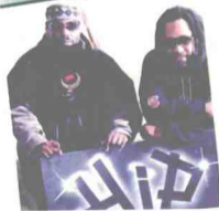
Bambaataa & Kool Herc

“嘻哈教父”阿弗里卡·班巴塔说：嘻哈代表整个文化，说唱、MC、DJ都是嘻哈文化的一部分，服装和语言也是嘻哈文化的一部分。霹雳舞(Breakdancing)、霹雳男孩(B-Boy)、霹雳女孩(B-Girl)，你的行为、走路、模样、说话方式，这都是嘻哈文化。还有音乐，嘻哈音乐来自各色人种，不论什么样的音调和节奏，这都是嘻哈。