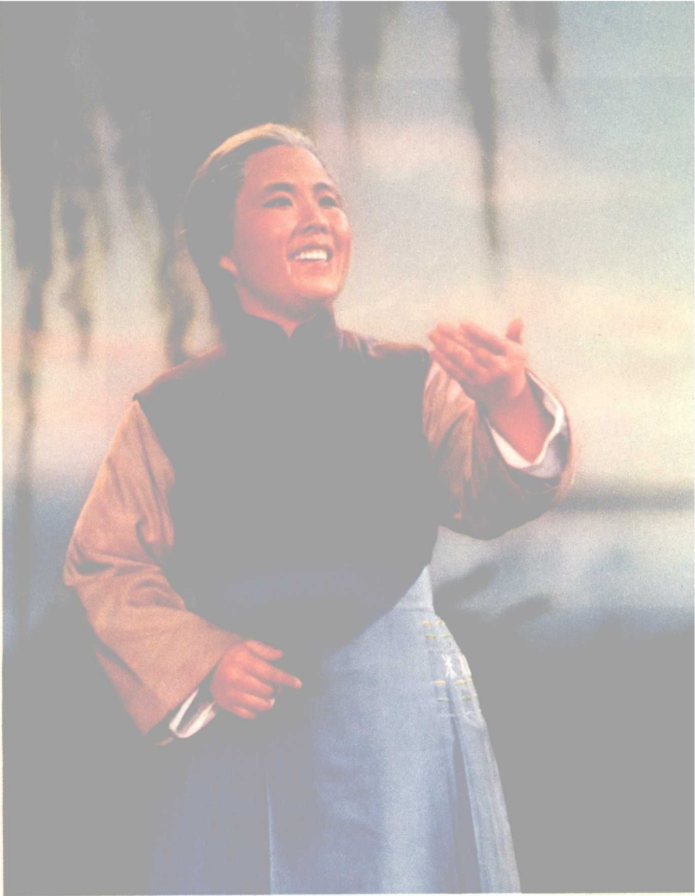
沙奶奶——沙家浜群众积极分子。