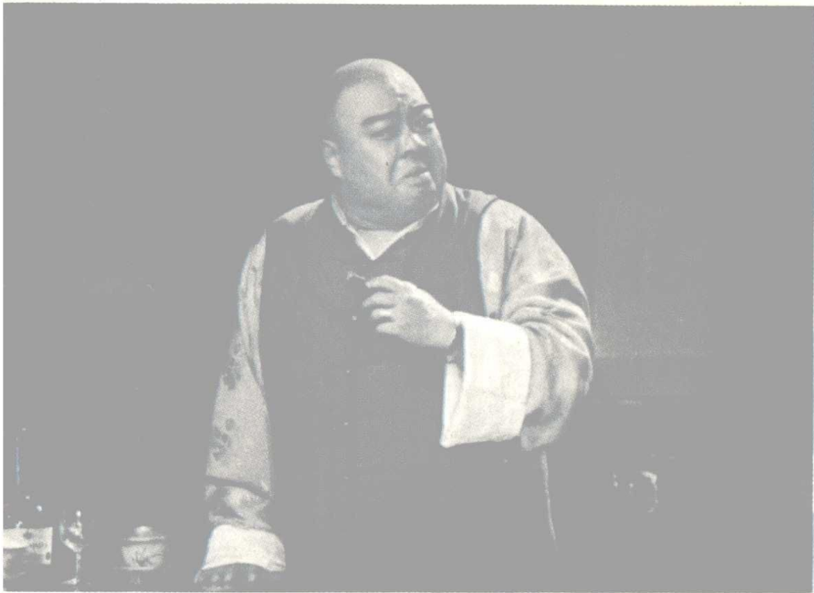
胡传魁——伪“忠义救国军”司令。