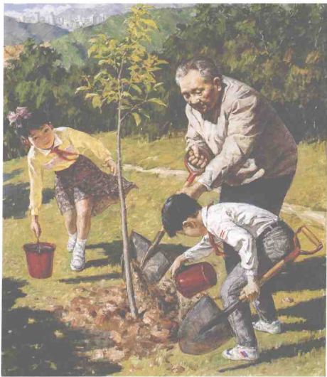
春天 油畫 陳宏新