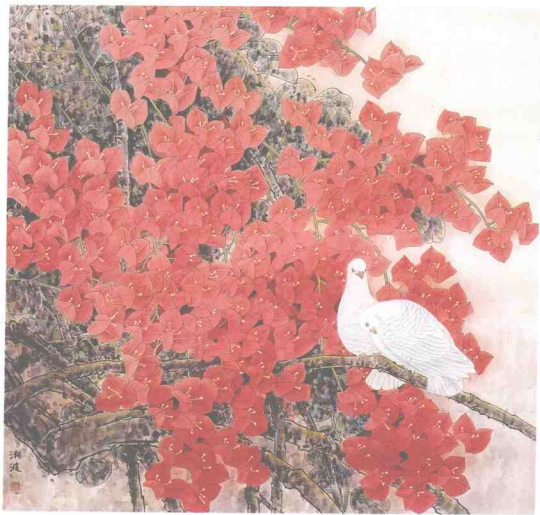
筋杜鹃 水墨畫 陳湘波