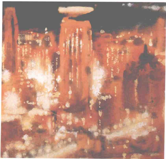
雨夜 水墨畫 董小明