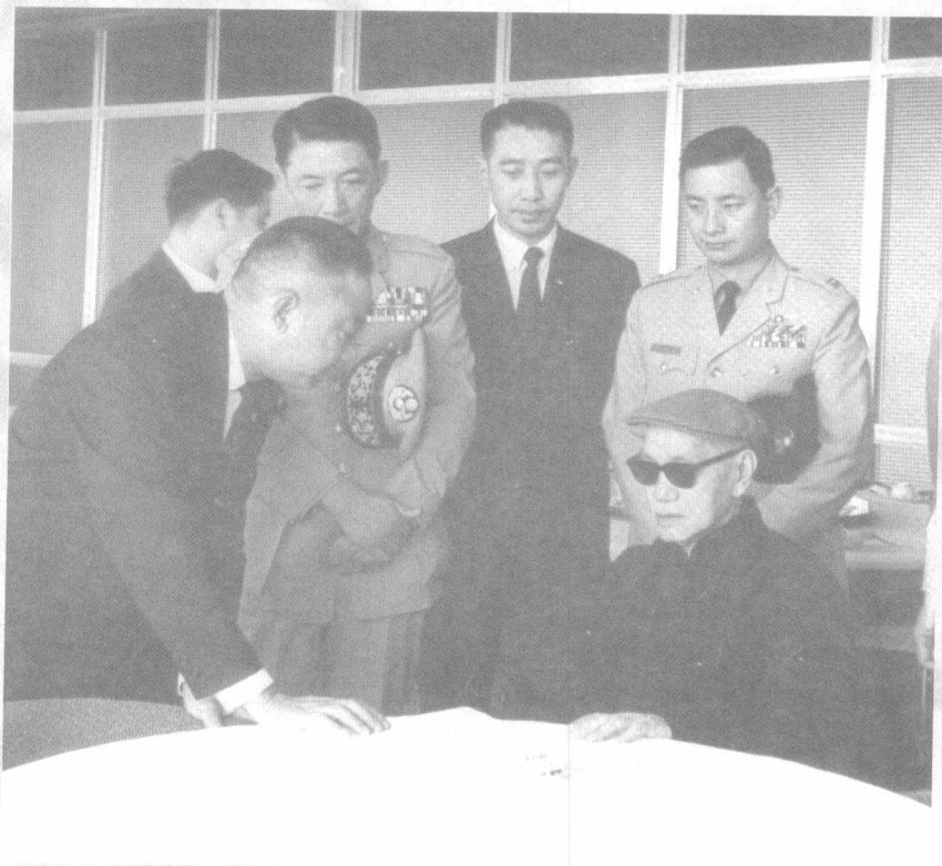
1968年，蒋介石视察台湾南部的垦丁宾馆，图中后立者左一为孔令晟、左二为翁元。