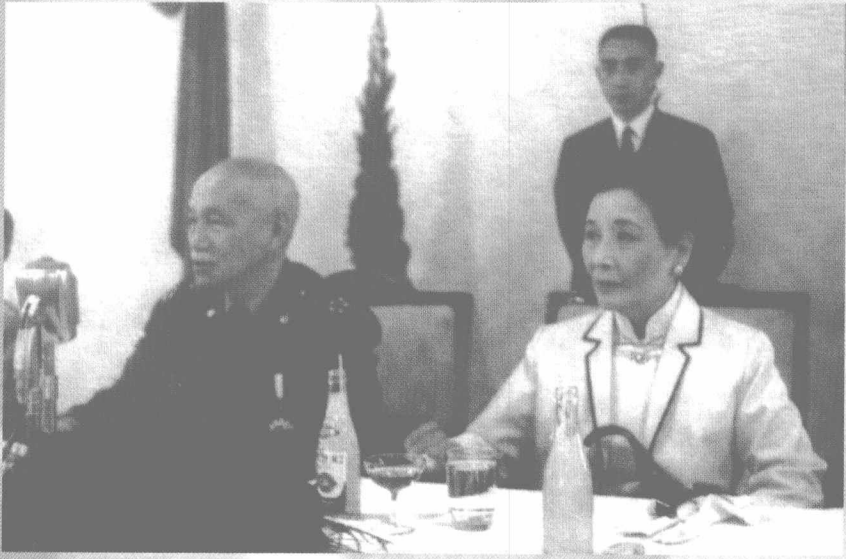
1968年，陆军官校校庆，蒋介石与夫人跟全体学生会餐。后站立者为翁元。