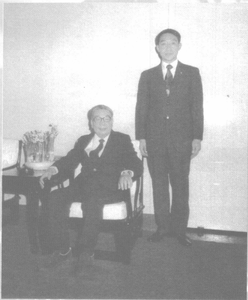
1978年春节，翁元与蒋经国合影于慈湖宾馆右厢房。