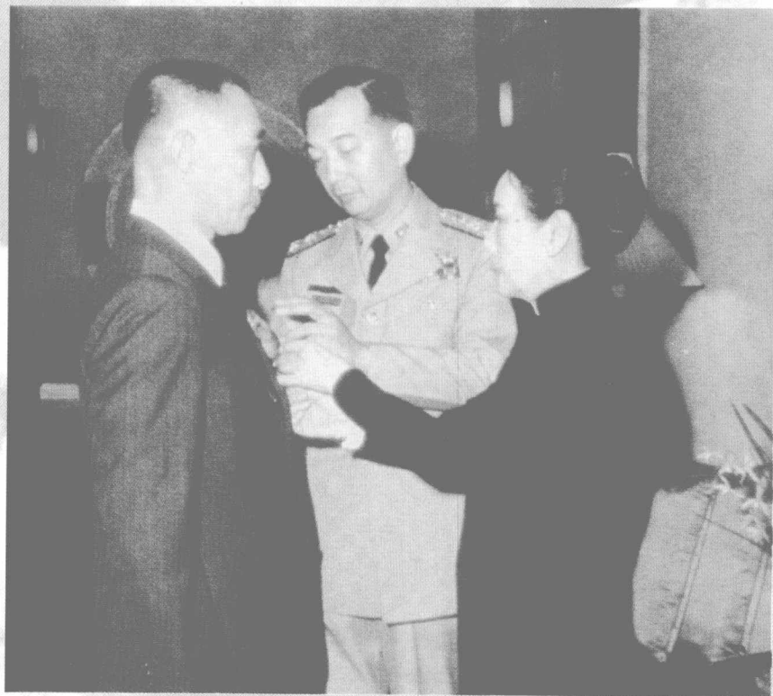
蒋介石丧事料理告一段落后，宋美龄为翁元颁发勋章，旁为侍卫长邹坚。