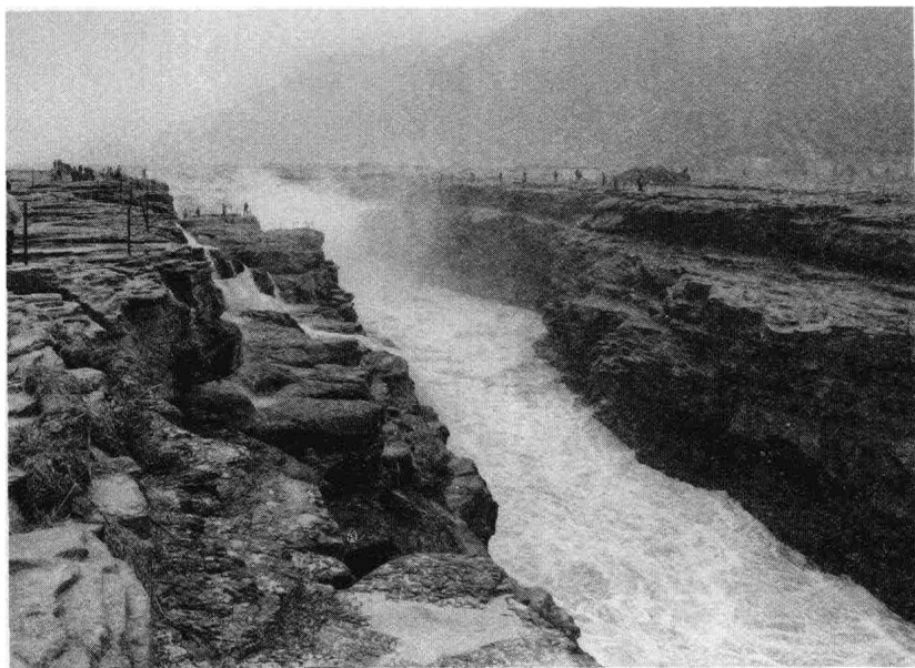
图5 黄河是中国文明的摇篮之一

文化玉器的发达在同时代中国大地的考古发现中几乎是无可比拟的，并证明着史前时代长江流域文明的先进性。这是仅次于黄河文明的古代中华文明的另一个中心区域。此外，在辽河流域，考古学家还发现了新石器时代非常重要的红山文化，它为了解上古时代北方的文明提供了难得的支点。