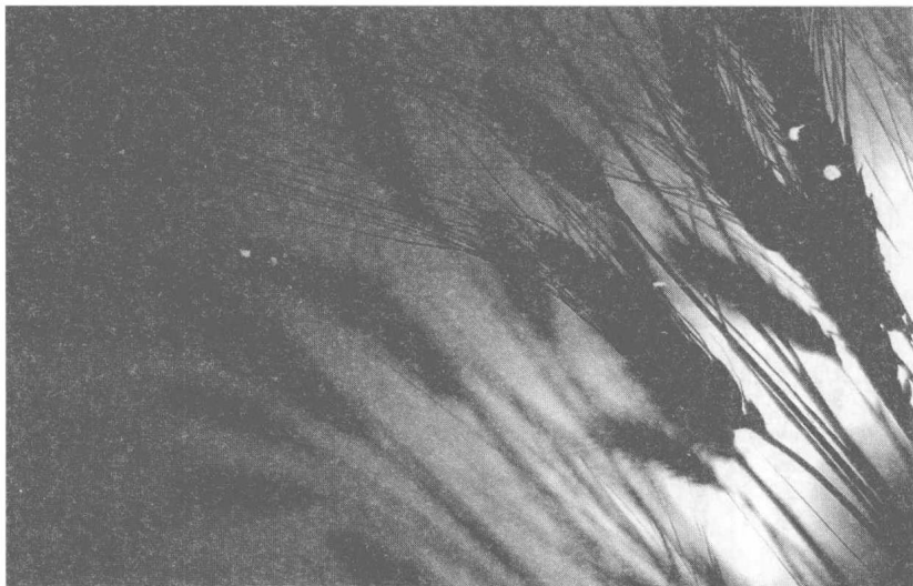
图2 农业奠定了中国文明的基础

在这个奠基的时代中，作为主要经济活动形式的农业承担着至关重要的角色。农业带来了聚居和合作，带来了规范人和人之间关系的最初秩序，带来了认识自然界的永恒动力，也带来了对人和天之间关系的既现实又终极的思考。《尚书》的第一篇《尧典》在称赞帝尧之后，提到的第一件事情就是“乃命羲和，钦若昊天，历象日月星辰，敬授民时。”古代中国天文知识的发达并不主要是人们对天象的纯粹兴趣，其最根本的原因乃是农事的需要，以及建立在农业文明基础上的对天和人与人之间关系的看法。作为中华文明最初的一部宪法，《尚书·洪范》中包含着农业文明对于世界、社会、政治、经