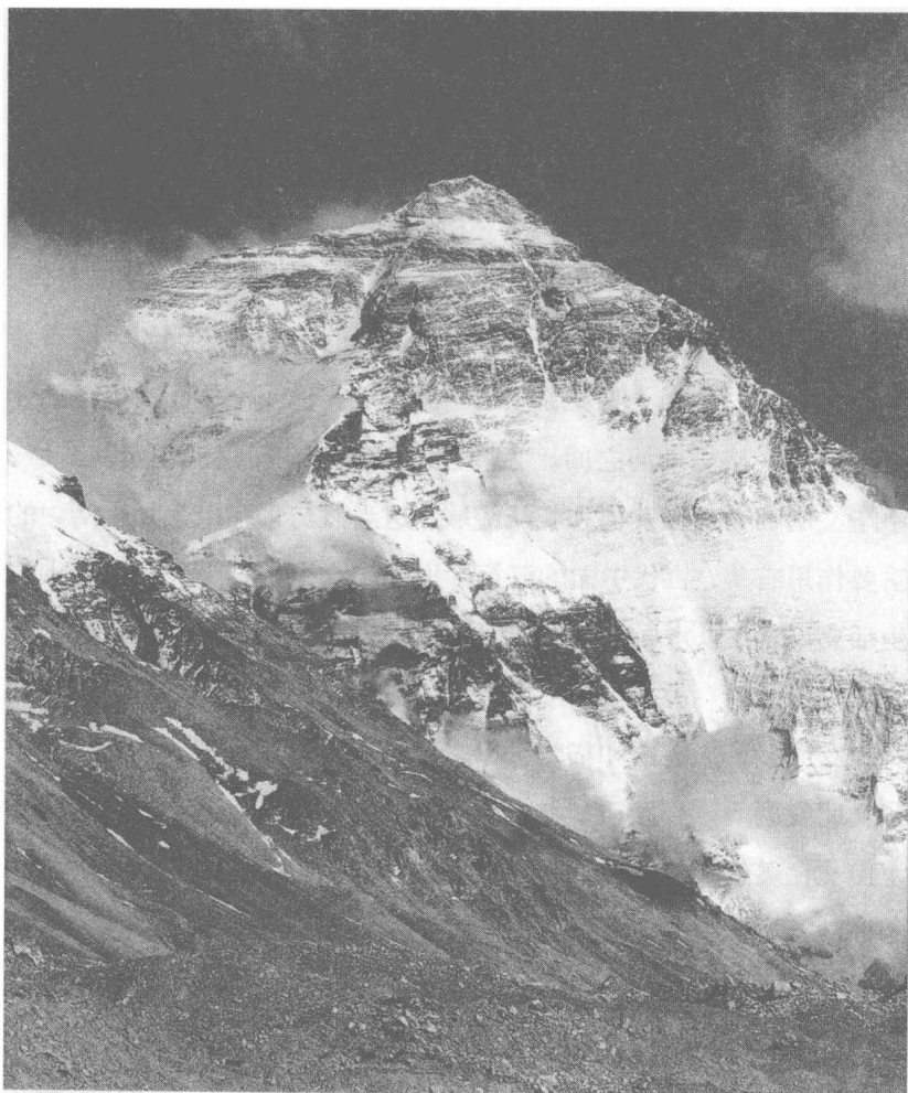
图4 中国文明的西部屏障

西部是帕米尔高原，从那里往东北有天山、阿尔泰山、蒙古戈壁沙漠、大小兴安岭、黑龙江和长白山等；从帕米尔高原往东南有喜马拉雅山、横断山脉和与中南半岛交界的一系列山脉；东部和东南部则是一望无际的海洋。在上古时期，这些屏障几乎是无法逾越的。这个封闭的环境决定了中华文明自主发生的特点，它很难受到其他文