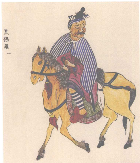
清《金筑百苗图》所绘彝族