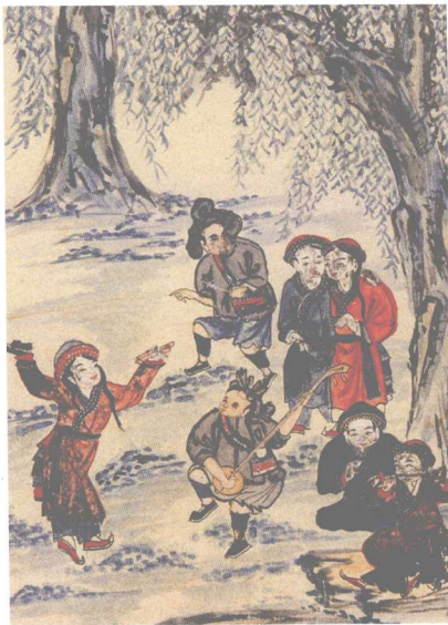
清《云南种人图说》所绘彝族