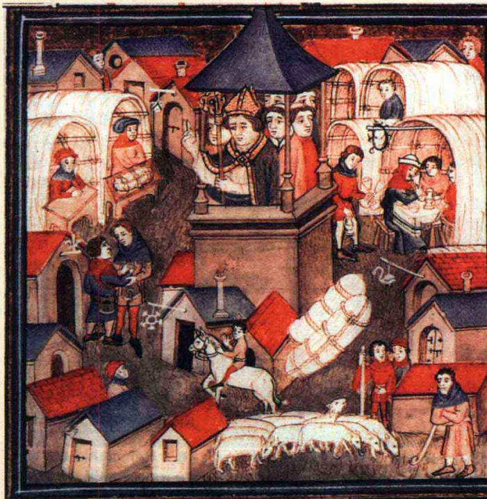
· 这幅古画描绘了中世纪城市里的一个集市， 主教还要为集市祈祷，希望它生意兴隆

村阔佬不一样，这些城市阔佬们不但识字，而且爱好文艺。第二类人是高级教士们，尤其是教皇。他们喜欢用一些伟大的艺术作品来表达他们对神的崇信。因此也来赞助艺术，邀请一些著名的艺术家雕刻一些神像，拉斐尔的大量圣母像、米开朗其罗的《末日审判》等就是这么来的。尼古拉斯五世、庇护二世、朱利乌斯二世、利奥十世等教皇都这样在艺术之上花了大量的时间与金钱。