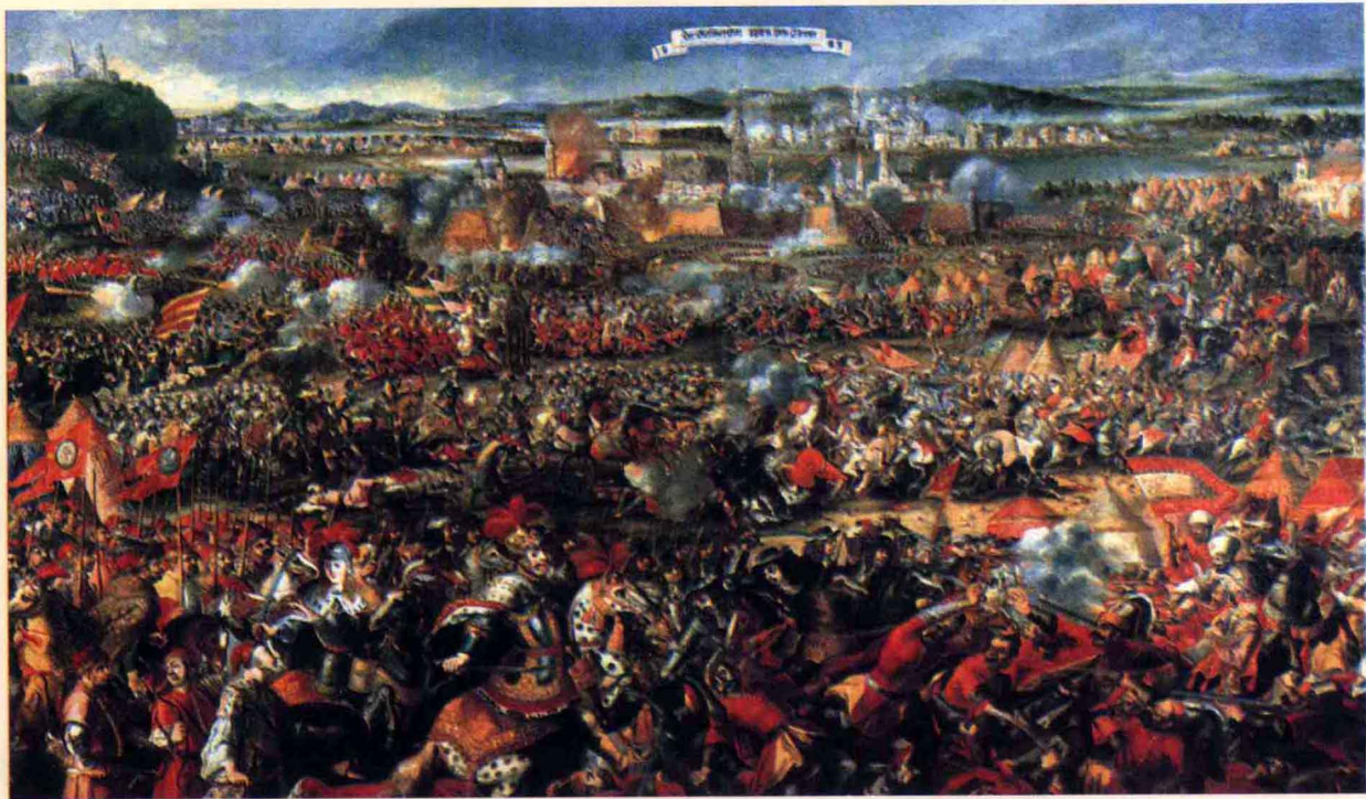
· 《维也纳的包围》，这幅油画描绘的是17世纪时强大的土耳其人围攻维也纳的情景

首先是十字军东征。我们第三卷刚说过，中世纪时为了夺取圣城耶路撒冷，骑士教士们先后组成了八次十字军东征耶路撒冷，他们最后的结局虽然是可耻的失败，但那些为首的君主贵族却收获颇丰，劫掠了大量金银财宝，其中也包括不