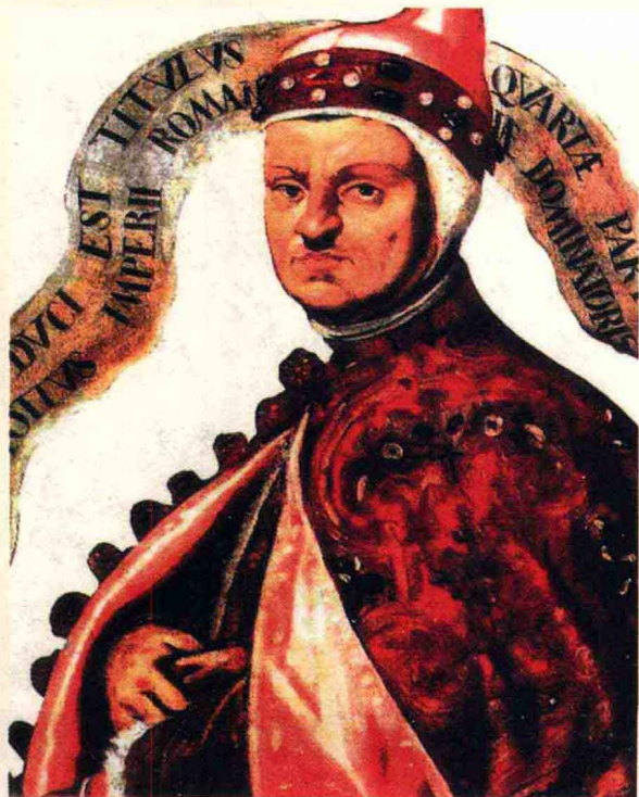
· 英诺森三世肖像，他在位期间教会势力空前强大

在十字军从拜占庭掠夺来的大批珍宝中，有许多是古希腊罗马的经典之作。还有，在陷落前后，许多有文化的东罗马人，包括许多出色的学者，带着他们的珍藏逃到了西方，这些珍藏也是古希腊罗马经典，如柏拉图的哲学著作、西塞罗的文学著作等。