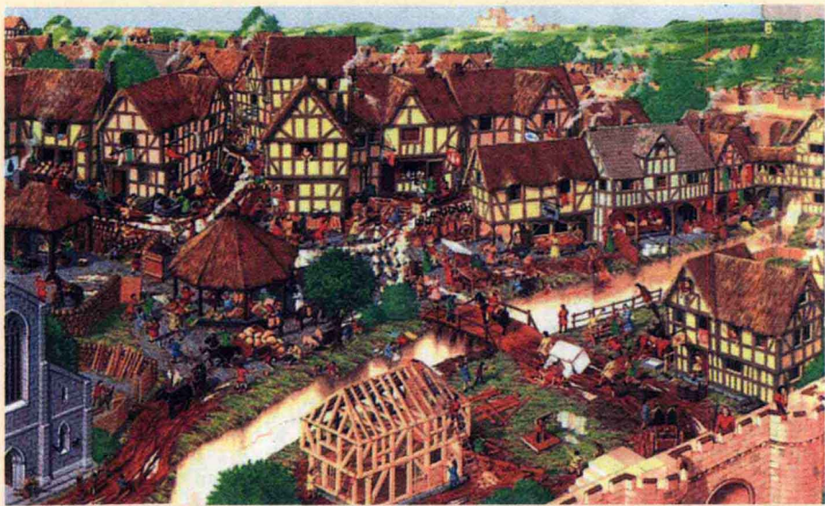
· 中世纪英国的某座 城市，建筑密集， 人群熙熙攘攘

斗的地方艺术是没办法发展的，这就是说，文化与艺术的发展需要一个强大的经济基础。这是我们随时随地都可以看到的，例如现在，文化艺术最发达的地方岂不也是经济最发达的地方——西方？中国也一样，如果想发达文化，必先发展经济，发展经济才是硬道理。