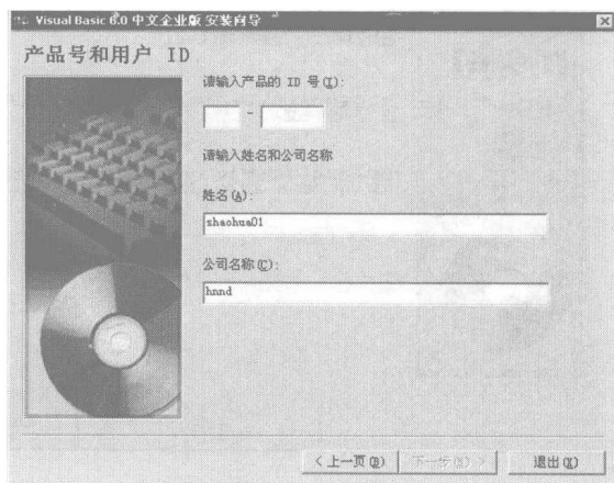
图 1-3 输入产品 ID 号

(3) 系统打开如图 1-4 所示的对话框,选中“安装 Visual Basic 6.0 中文企业版”单选按钮,单击“下一步”按钮。