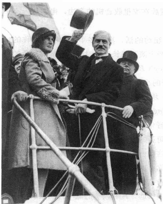
麦克唐纳首相和夫人到 访美国

发表的。(是的，在1929年的国际关系中，国际联盟是一个重要因素，尽管几乎算不上是决定性因素。)麦克唐纳在演说中宣布，英美之间为限制海军军备而举行的谈判进展顺利，而且，全面协议似乎近在眼前。他希望不久之后访问美国，以促成这一协议。(他会来的，就在不久之后，他和胡佛总统将在胡佛的乡村营地附近、拉皮丹河边的一截圆木上坐下来交谈。)