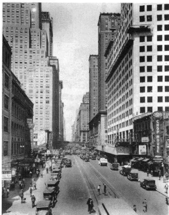
1929年的街景 (纽约第42大街)

显然费了老大的劲儿。梅·韦斯特的曲线尚未发挥全国性的影响。腰部——如果那也能叫作腰的话——跟臀部一样浑圆。裙子很短，只比膝盖低那么两三英寸：比她们在1939年之前想要一短再短的还要短。（新款晚礼服无背无袖，有嵌布片、三角布或拖到脚踝的垂饰，但礼服本身还是很短。）每件上衣都有V型领，就连针织套衫几乎也都有。如果这是一个冷