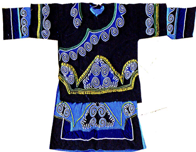
图1-10 昭觉的半袖和右衽上衣是前后衣片相连，袖与衣身连片，没有肩缝和肩部造型的平面型服装结构