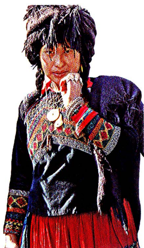
图1-8 美姑右衽绣花上衣属裁剪型服装