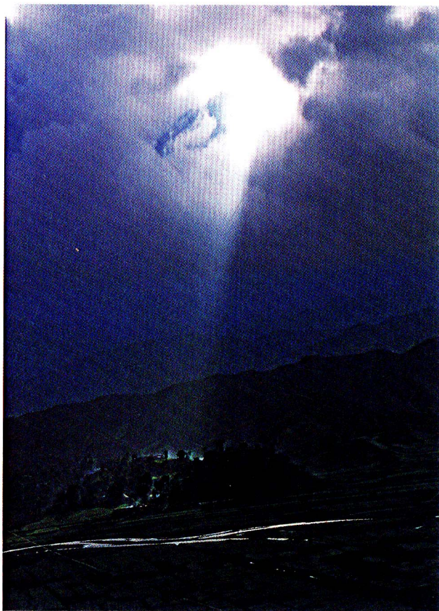
图1-1 在凉山这片神奇而古老的土地上孕育了彝族人民和他们辉煌的历史和文化

本族崇拜，创造了令人叹为观止的神话传说、歌谣、雕刻、绘画、音乐、舞蹈、建筑和独特的餐饮文化等，同时还传承和保留着我国彝族最古朴、浓郁而独特的服饰文化。