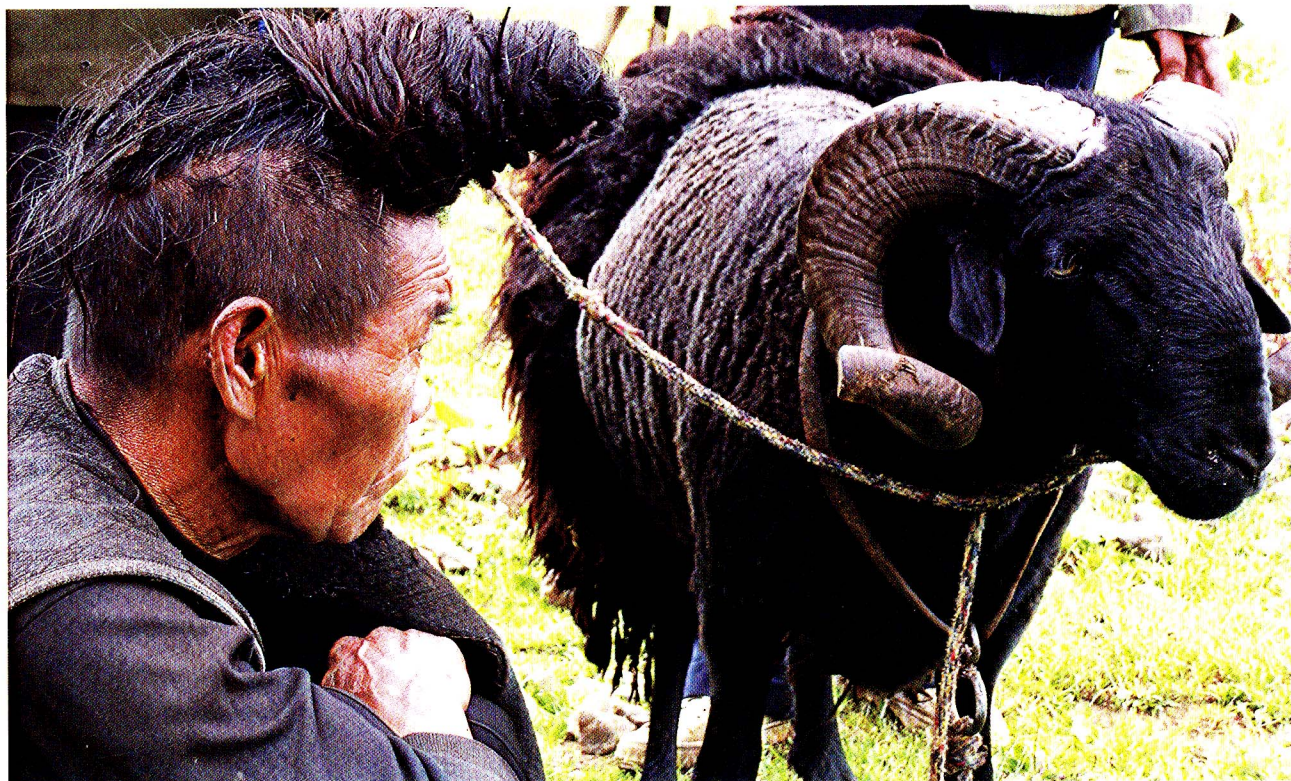
绵羊毛、彝人衣，此景呈现出人与自然共生的和谐关系

跟彝族妇女学习纺纱、腰机织布、剪纹样、绣花等技艺，心里怀着与彝家女一比高低的真实情感，从而使自己已由体验引发与其文化的情感共鸣。