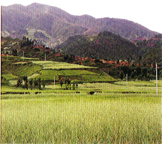
图1-2 凉山依山而居的瓦板房和他们的的主要农作物燕麦、荞麦