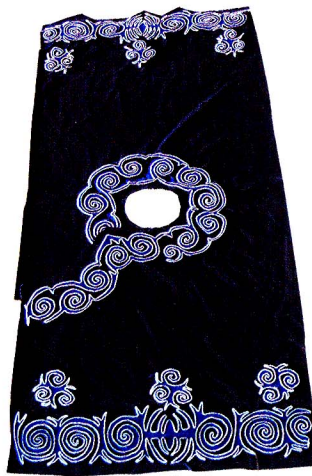
图1-9 上衣的平面结构展开图