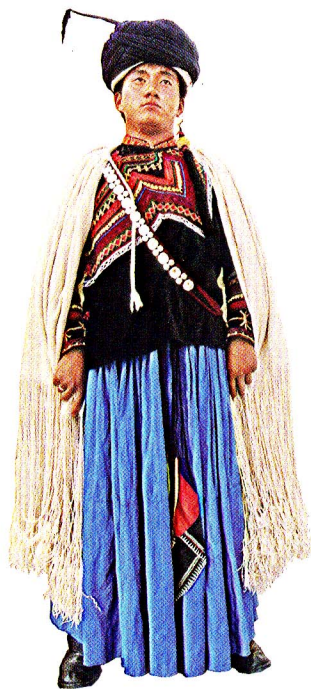
图1-3 美姑大裤脚男装

虽然凉山各彝族地区的服饰风貌和组成在细节上千差万别，但从整体来看仍然具有共同的地域和文化特征。比如服装，男子穿右衽大襟上衣，下着长裤，并因方言区、地域不同而有大、中、小裤脚之分（图1-3）；女子穿右衽绣花上衣，高高的立领与衣身分离，领面上贴银泡、绣精美的纹样，领口装饰各式夸张的长方形银领牌，使颈部修长而更显仪态端庄，下着百褶裙，在右边配挂富有装饰感的三角形荷包（图1-4）；无论男女老少，皆常年披察尔瓦、披毡；用于制作服装的衣料以自织自染的绵羊毛织物为主；服饰饰花工艺主要有镶嵌、贴花、