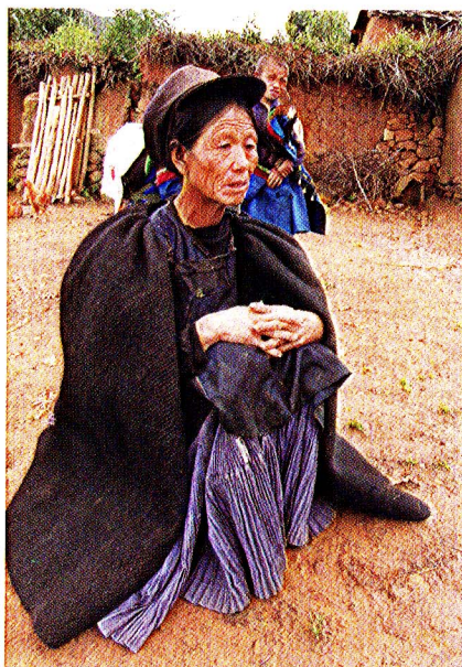
图1-7 以手工擀制而成的披毡属于织造型服饰

正方形、三角形等几何裁片，这种缝合型服装不具有个性化特征，不同年龄、不同身材的人皆可穿着，如凉山的察尔瓦即属此类型。裁剪型是在缝合型基础上的进一步发展，即根据人体尺寸用剪刀将面料裁剪为比较适合人体的几何形裁片，再经大量的严密缝合，制作成能展现人体美的精美服装，如凉山的石砣绣花上衣、精美的半袖罩衣、背心等。由此凉山彝族服饰从单块面料披裹式发展到多块衣料稍加缝制的坎府、察尔瓦披衣，到“量体裁衣，看头