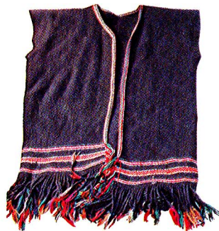
图1-6 衣领处稍加挖剪、底摆有吊穗的贯头衣