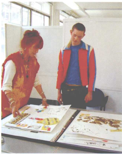
大学的面试教师总是希望能看到学生记录作品的速写簿、草稿以及实物作品。