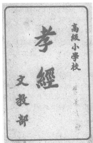
伪满洲国成立后立即颁布训令，废止有排日内容的教科书，在未编写出奴化教科书之前，暂以《孝经》为教材。这是初级小学校的《孝经》课本（文教科1936年）。

当时把日语列为学校的主科，强迫学习，目的是使我们学会了它的语言，可以老实驯服地听从它的指挥驱使。在“满洲国歌”里面，说什么“顶天立地，无苦无