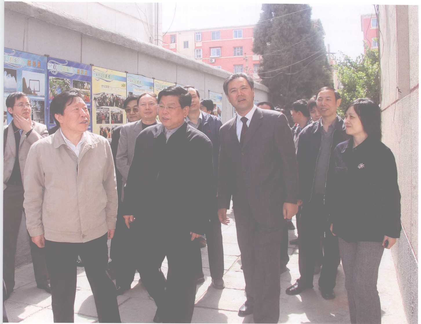
全国政协副主席、中国文联主席孙家正(左二)在中国文联领导胡振民(左三)、杨志今、廖奔等的陪同下来中国摄协办公地点红星胡同，在中国摄协李前光(右三)等领导的陪同下参观61号院的办公环境。