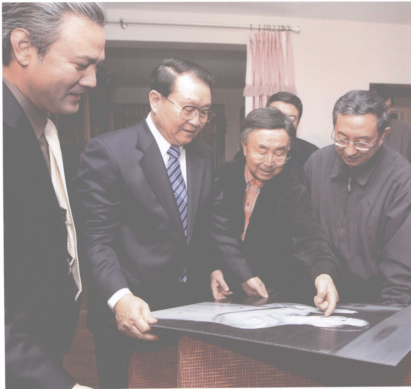
吕厚民（左三）向中共中央政治局常委李长春（左二），中宣部常务副部长雒树刚（右二），中国文联党组书记、副主席胡振民（右一）、中国文联主席团委员、中国摄协分党组书记、副主席兼秘书长李前光（左一）介绍自己的代表作。