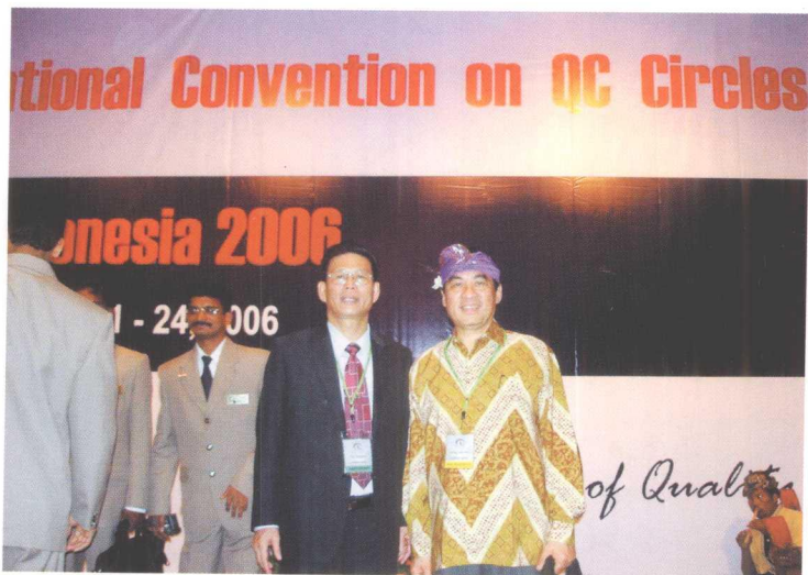
叶斯水董事长参加印度尼西亚 2006 国际品管圈会议