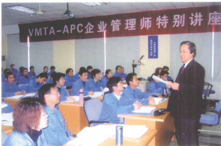
VMTA-APC 企业管理师特别讲座学员们认真学习