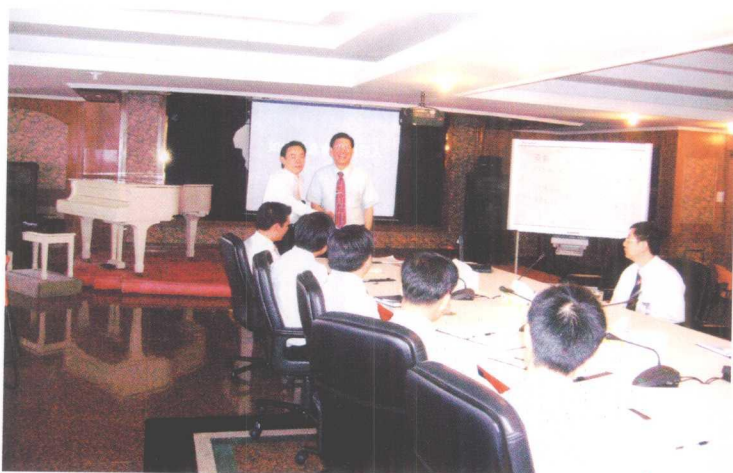
叶斯水董事长为湖南远大空调有限公司高级管理人员做《如何塑造卓越领导人》精彩演讲