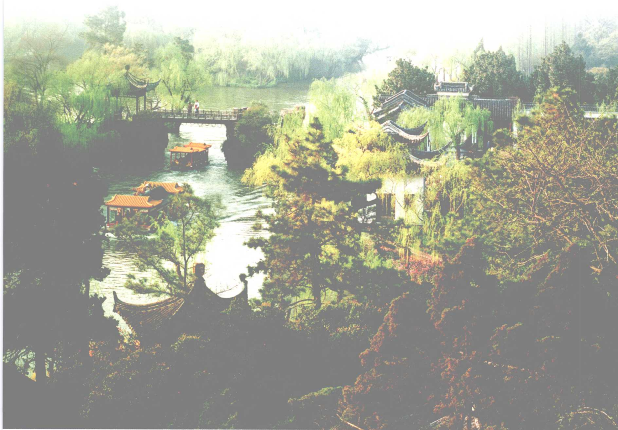
烟花三月