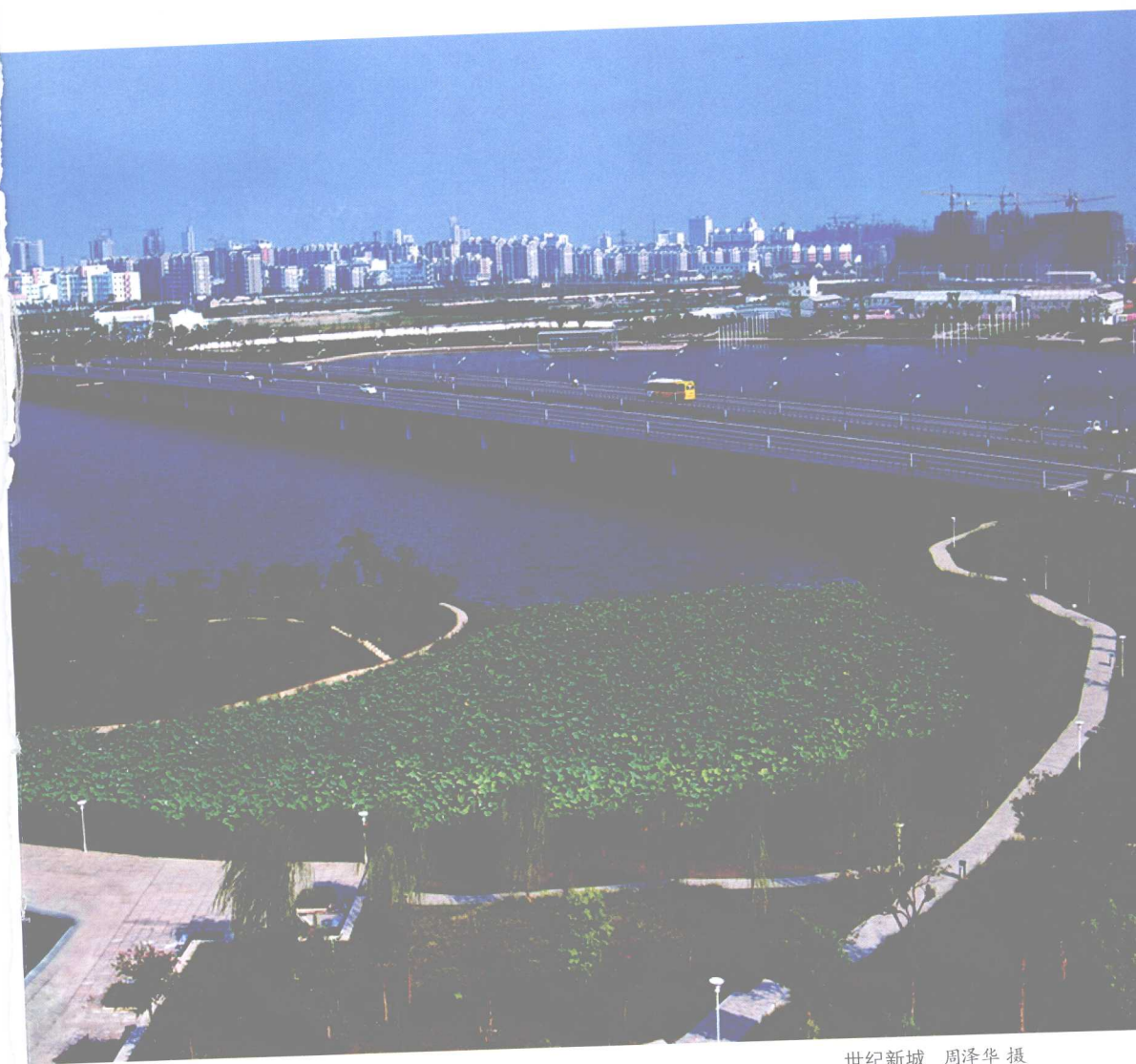
世纪新城