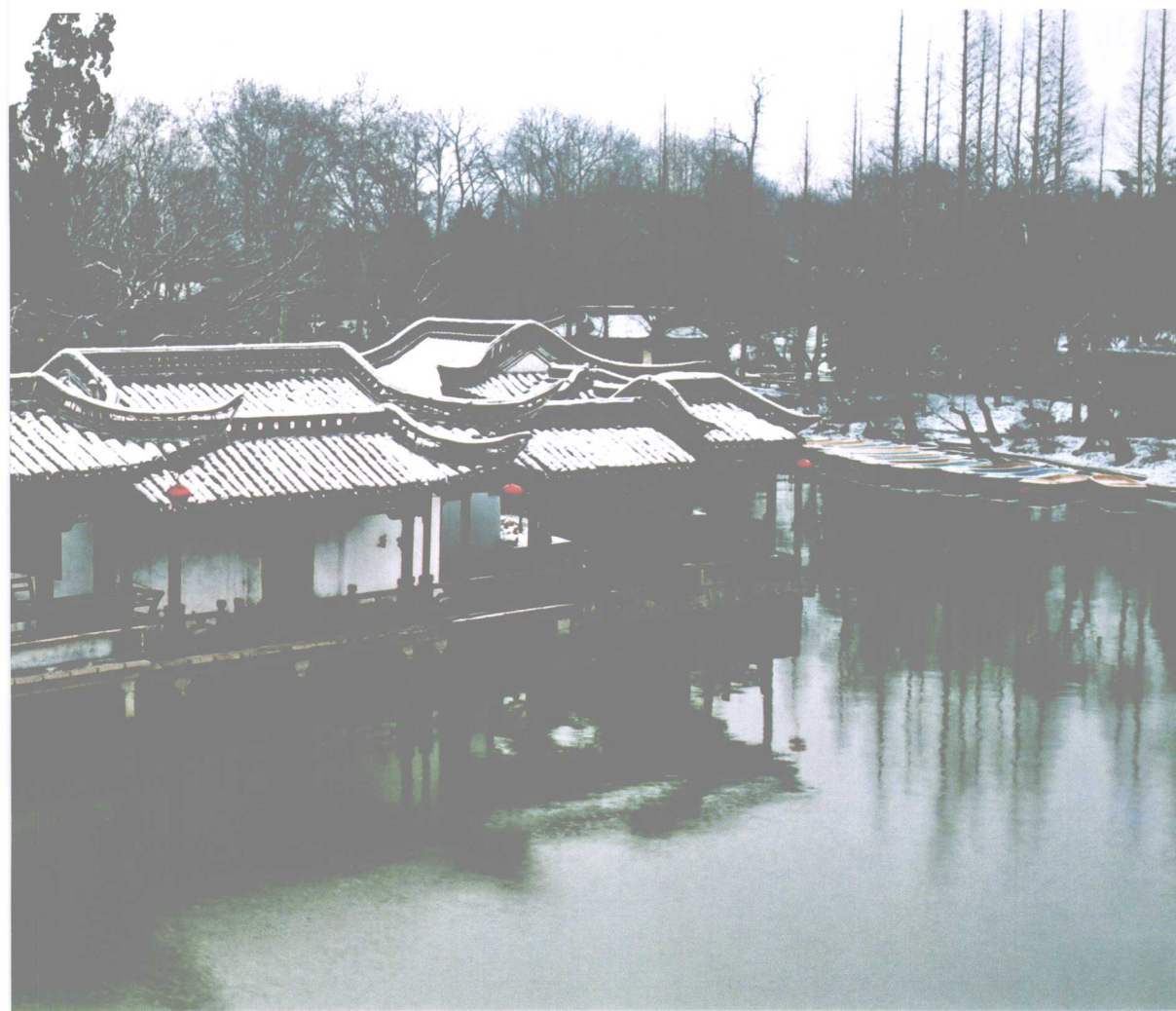
碧玉妆成