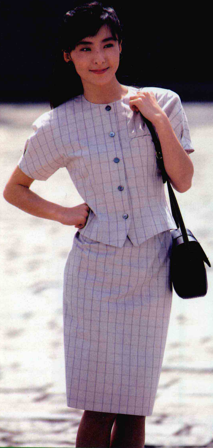
秀丽的窄裙夏套装