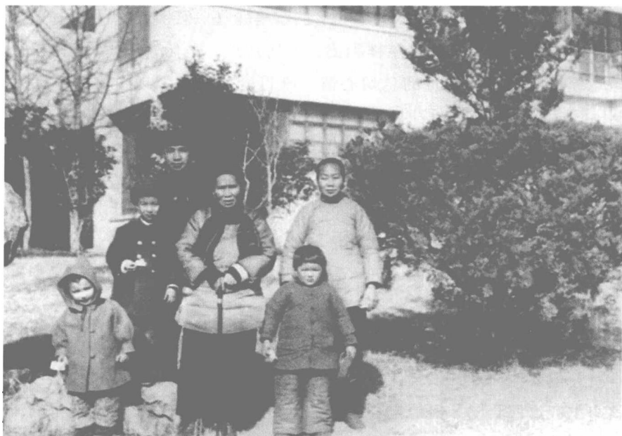
1951年粟裕与母亲、大姐等人的合影。

复杂，但很繁琐，粟裕经常因此不能按时上课、交作业，学习成绩下降，不得不留级。这件事叫粟裕心烦。