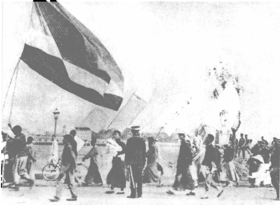
1919年5月4日，爆发了震动全国的“五四运动”。这是北京学生在天安门前游行的情景。