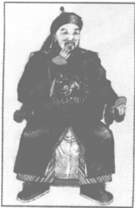
陈赓祖父陈翼琼像。

亥革命，终于推翻了清政府。陈赓的家乡湖南省，当时是最富有朝气的省份之一。清朝末年的变法维新时，浏阳县就出了个名士谭嗣同。辛亥革命后，谋求中华民族获得彻底解放的先进人士，继续沿着艰苦的道路寻找革命真理，谋求国家民族的出路，势不两立的两种社会力量进行着殊死搏斗。1917年俄国十月革命一声炮响，给中国送来了马克思列宁主义，给在黑暗中摸索前进的中国人民指明了方向。在伟大十月革命的影响下，1919年爆发了震动全国的“五四运动”，使中国革命的面貌为之一新。