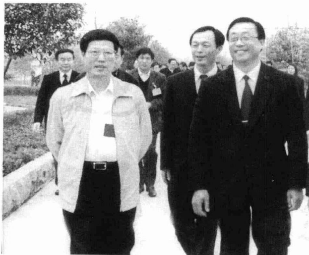
二〇〇四年四月，时任济宁市副市长、兖州市委书记韩军（右一），兖州市委副书记、市长于建民（右二）陪同原山东省委书记张高丽（左二）在兖州视察。