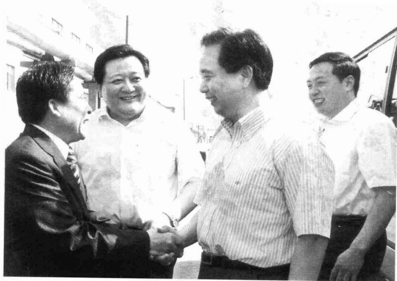
2007年6月，济宁市委书记孙守刚（右一）、兖州市委书记江成（左二）陪同山东省委书记李建国（右二）在兖州银河集团视察。图为李建国书记与山东银河集团董事长、总经理牛宜顺（左一）亲切握手。