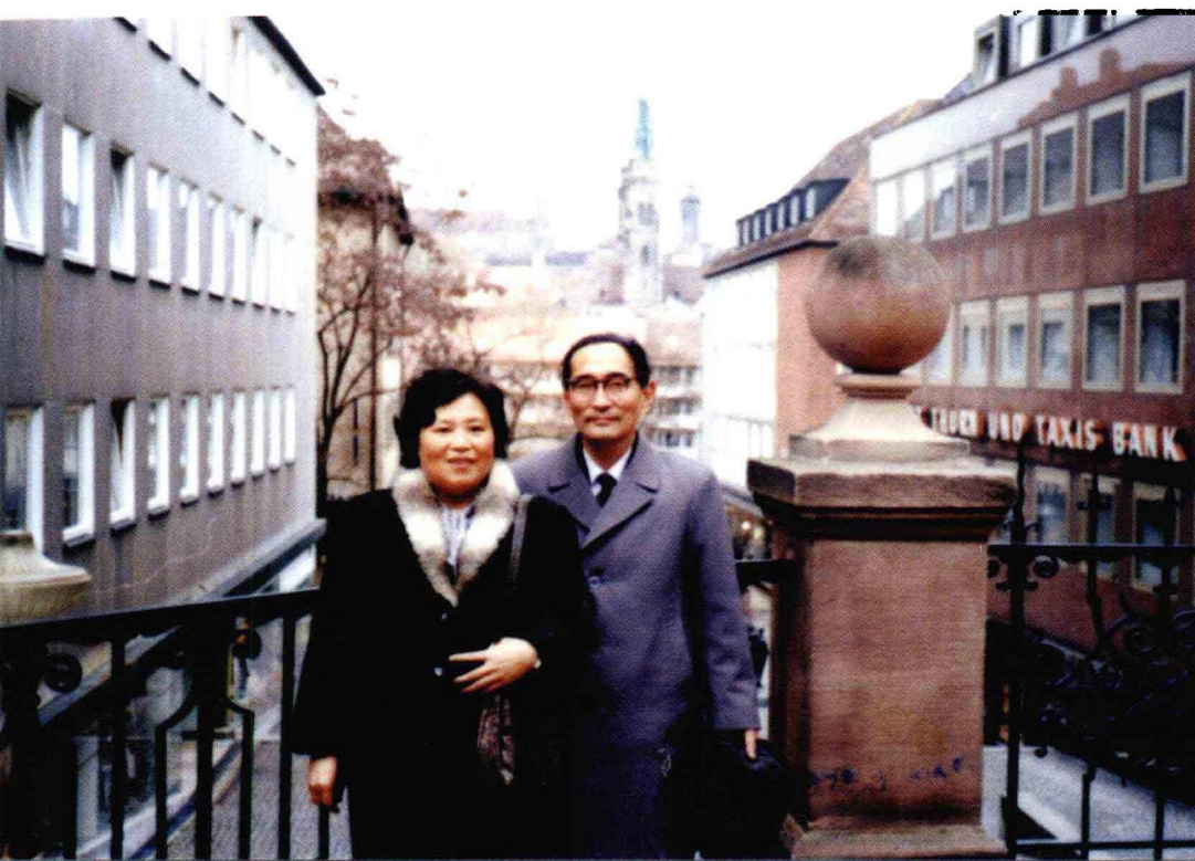
摄于德国纽伦堡 (1989年,结婚三十一年留念)