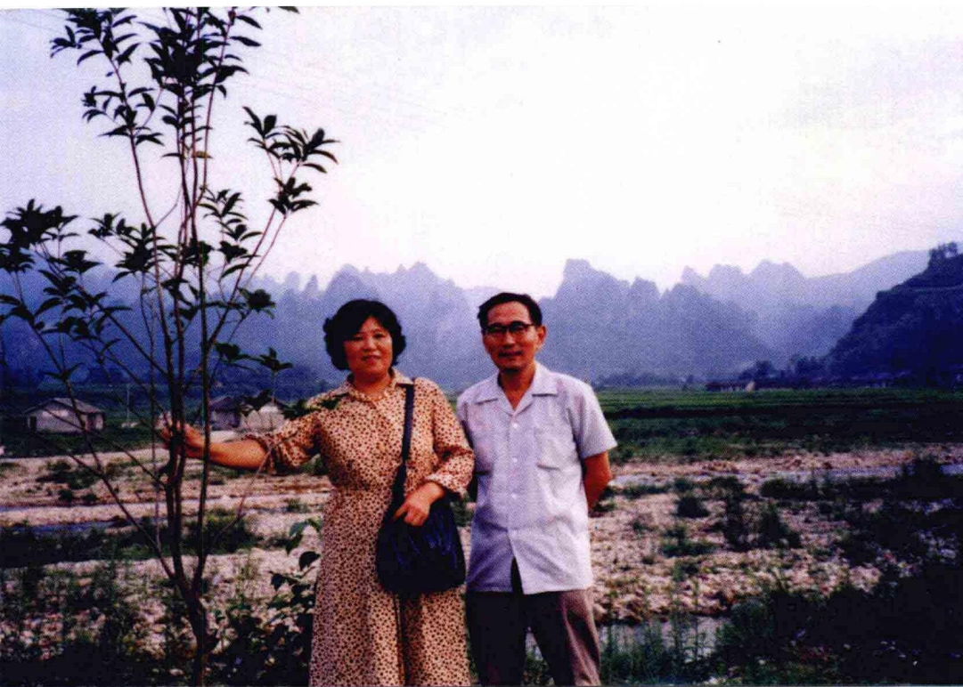
摄于湖南张家界 (1988年)