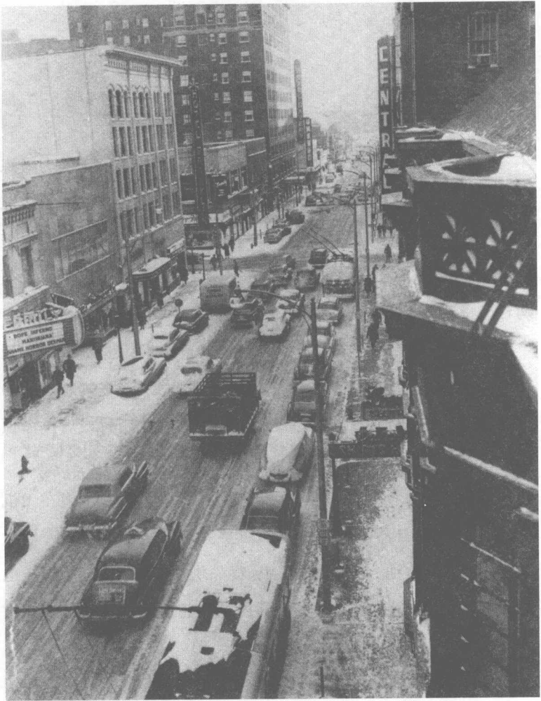
1930年代，美国城市在冬季的街道景象。图中展示了繁忙的街道，积雪覆盖的路面，以及来往的车辆和行人。背景中的高楼大厦和商店招牌，如“CENTRAL”和“NOPE OFFERS HANDMADE HATS BOBBY BROWN DESIGN”，进一步突显了城市氛围。