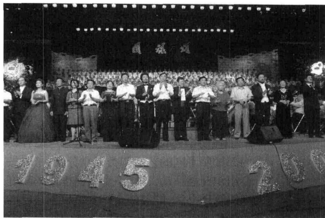
《国魂颂》——纪念抗日战争胜利60周年大型交响合唱音乐会

坚持以人为本的原则,尊重、理解文艺家。要关心文艺家的创作、学习和生活,切实维护文艺家的合法权益。要在改善待遇、提供经费、展示成就、传承艺术等方面为文艺家尽心尽责地办实事、解难事,帮助文艺家解决实际困难。要重视对中青年文艺人才的扶持和培训,坚持举办文艺新人的展示展演和各类比赛,举办已取得一定成绩的艺术家人作品展、展演和研讨会,为他们的进一步提高