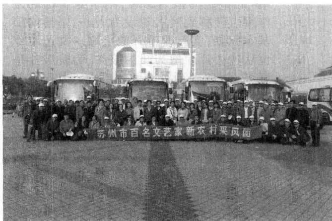
苏州市文艺家新农村采风

1978年党的十一届三中全会犹如一声春雷,驱散了笼罩在祖国大地上的重重阴霾,拨乱反正,正本清源,党领导人民实行改革开放,引领中国这艘巨轮绕过暗礁,调整航向,乘风破浪,驶向中国特色社会主义目标。在党的正确的文艺方针指引下,苏州文联于1979年恢复活