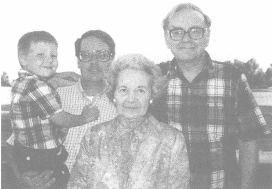
◎ 沃伦·巴菲特和他的母亲及家人。

外，纸币持有人可以自由选择兑换成一定量的黄金。只有国会被迫这样做时，我们的金融才能走向有序。把我们的货币兑换成黄金就会产生这种强迫力。”商人们不会听他的，国会自然也不会听他的这种理论。