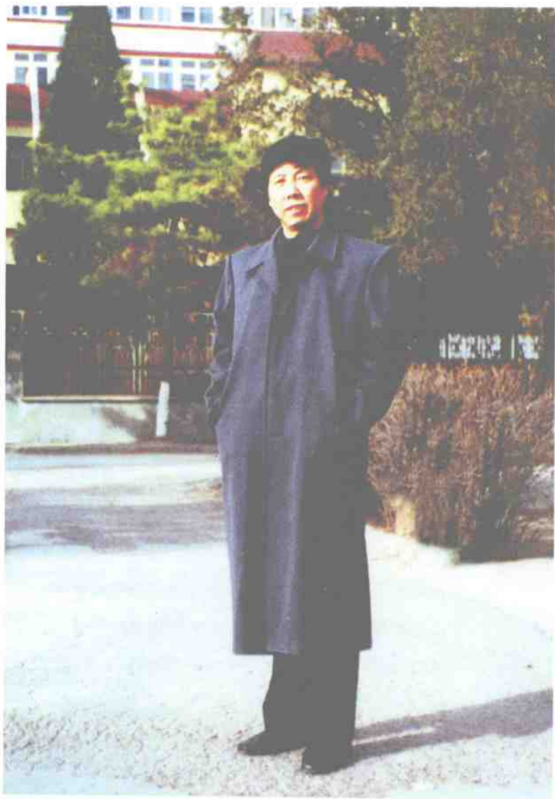
作者近照 2001年春摄于山城张家口