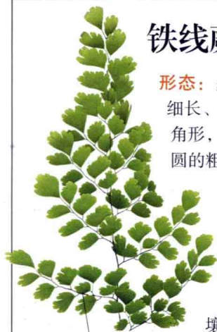
叶柄细长、坚硬，如铁丝

盆栽可置于案头、茶几上；较大盆栽可用于布置背阴房间的窗台、过道或客厅。② 叶片是良好的切叶材料及干花材料。③ 全草入药，用于治疗人畜疾病。