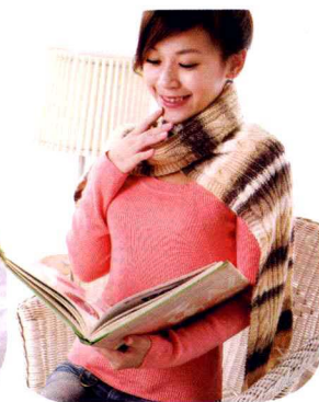
13 麻花渐层长围巾 (做法P62)