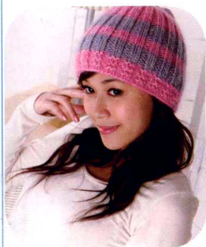
08 2×2罗纹帽子 (做法P52)