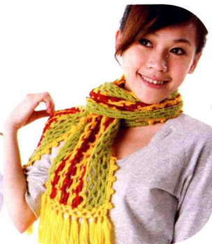
10 配色网花围巾 (做法P58)