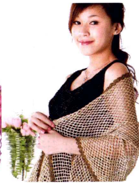
15 宴会披肩 V.S 玫瑰花 (做法P66~69)