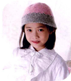
05 小学生帽 (做法P49)