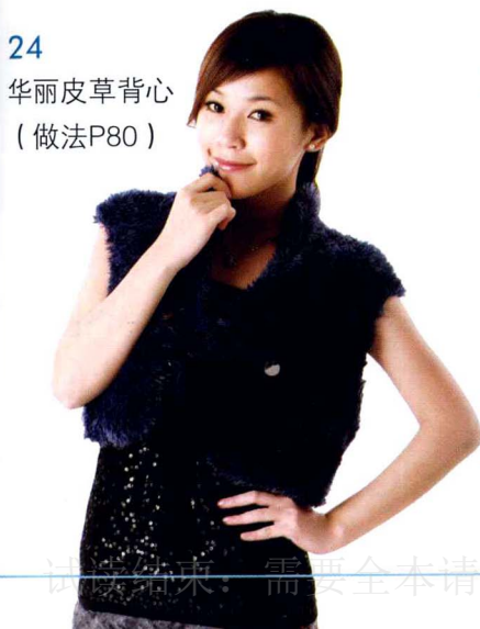
24 华丽皮草背心 (做法P80)