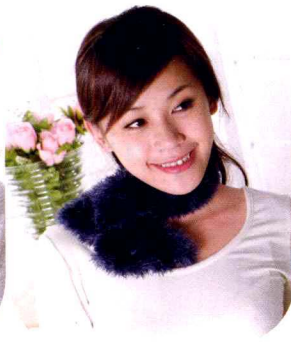
11 皮草小领巾 (做法P59)