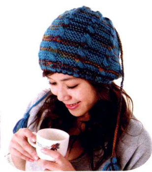
07 麻花帽 (做法P54)