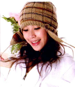
09 活动型罩耳帽 (做法P56)