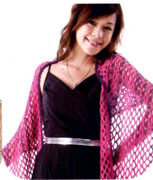
14 横钩披肩围巾 (做法P64)