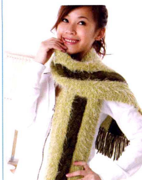
12 纵编配色围巾 (做法P60)