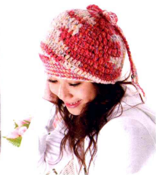
06 贝蕾帽 (做法P50)