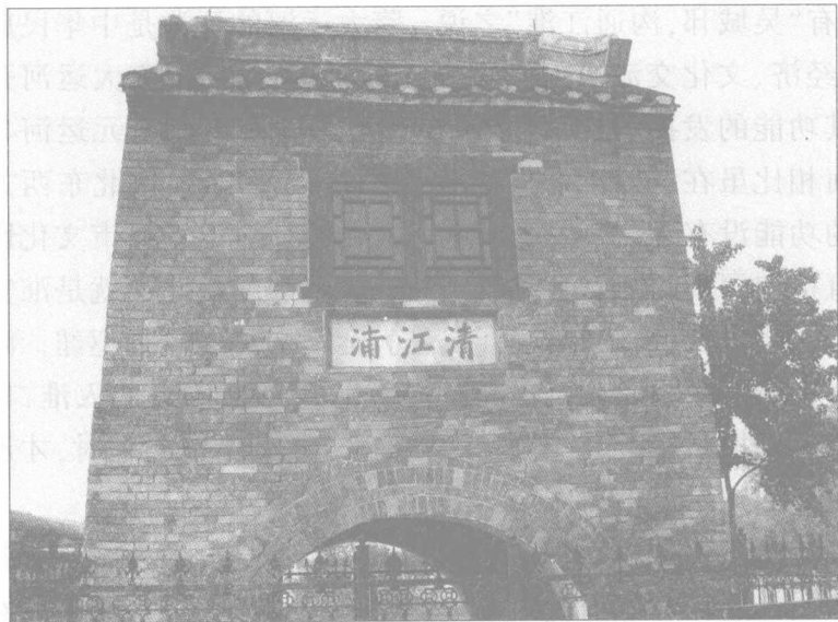
清雍正年间的清江浦楼

以上七个方面的内容,除史书和地方志书记载外,还有很多实物遗存,并有民风、风俗、曲艺等丰富的与运河相关的非物质文化遗产。淮安是运河城市,是国家历史文化名城,有五处文化遗存被列为国家重点文物保护单位:周恩来故居、明祖陵、淮安府衙、苏皖边区政府旧址和洪泽湖大堤;有16处文化遗存被列入国家重点文物保护单位京杭大运河的保护范围:漕运总督署遗址、古末口遗址、河下古镇、楚州西北运河东岸石堤、裴荫森故居、淮安钞关遗址、清江闸、丰济仓、清晏园、清江浦楼、清真寺、码头三闸、乾隆阅河诗碑、御制重修惠济祠碑、古清口遗