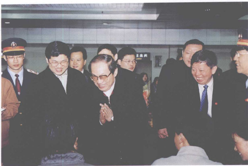
2004年农历大年初一，铁道部部长刘志军（前排中）在广铁集团公司董事长、总经理吴俊光（前排右），党委书记李文新（前排左，现任青藏铁路有限公司总经理）等陪同下，在深圳火车站向旅客拜年。