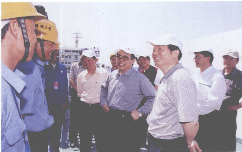
2004年，铁道部部长刘志军（前排右二）和海南省常务副省长吴昌元（前排右一）在广铁集团公司董事长、总经理吴俊光（前排右三）陪同下，在粤海铁路视察工作。