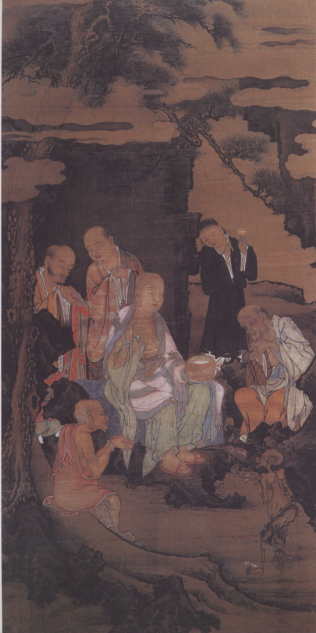
宋 周季常 五百罗汉图