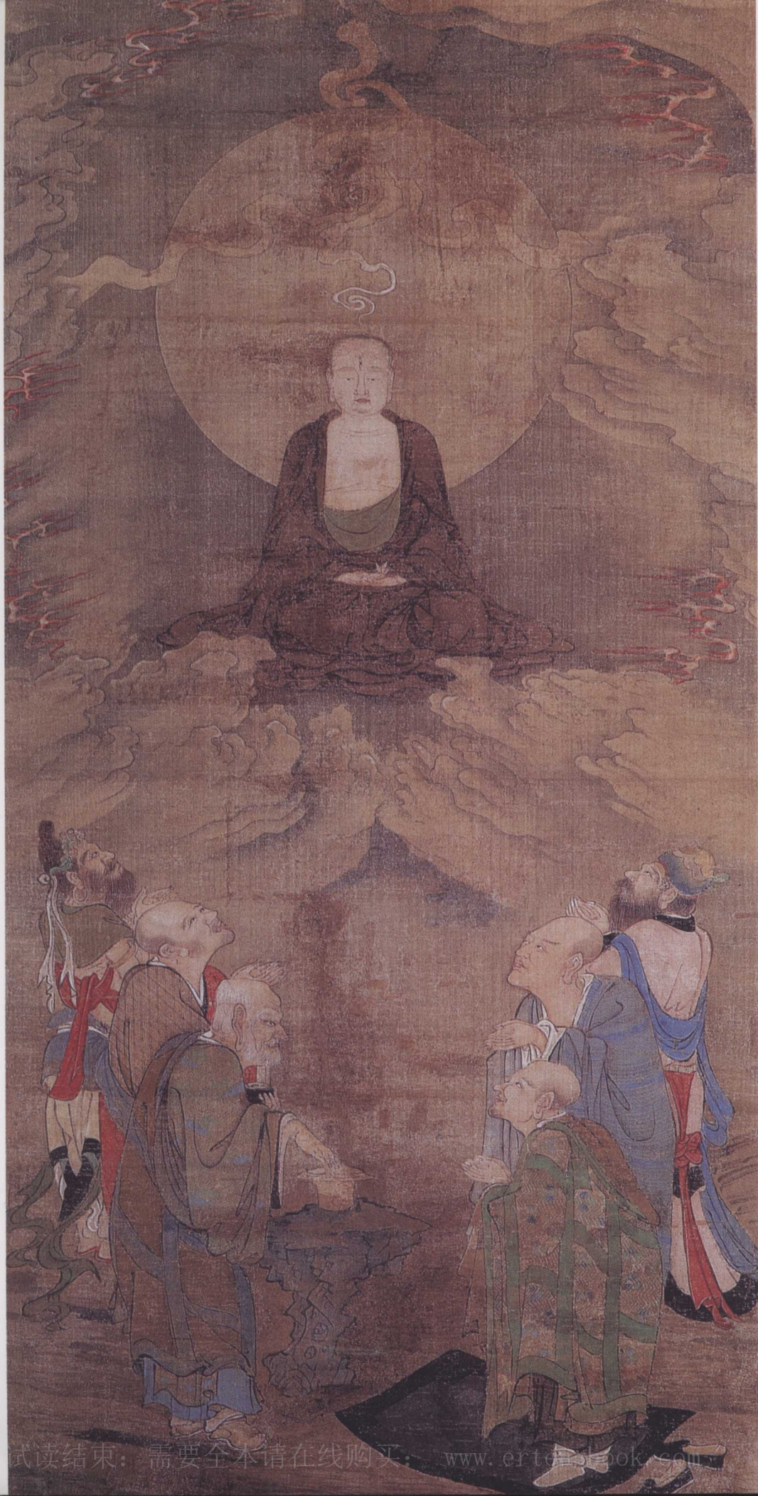
南宋 周季常 五百罗汉图