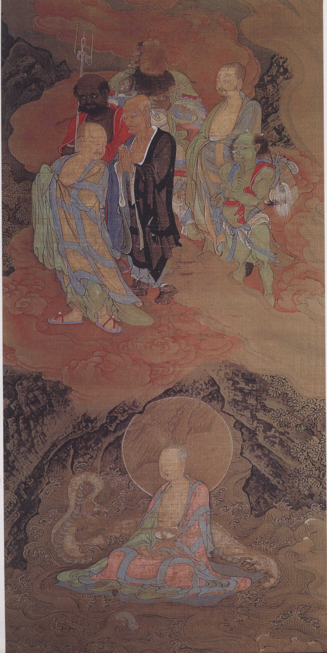
南宋 周季常 五百罗汉图