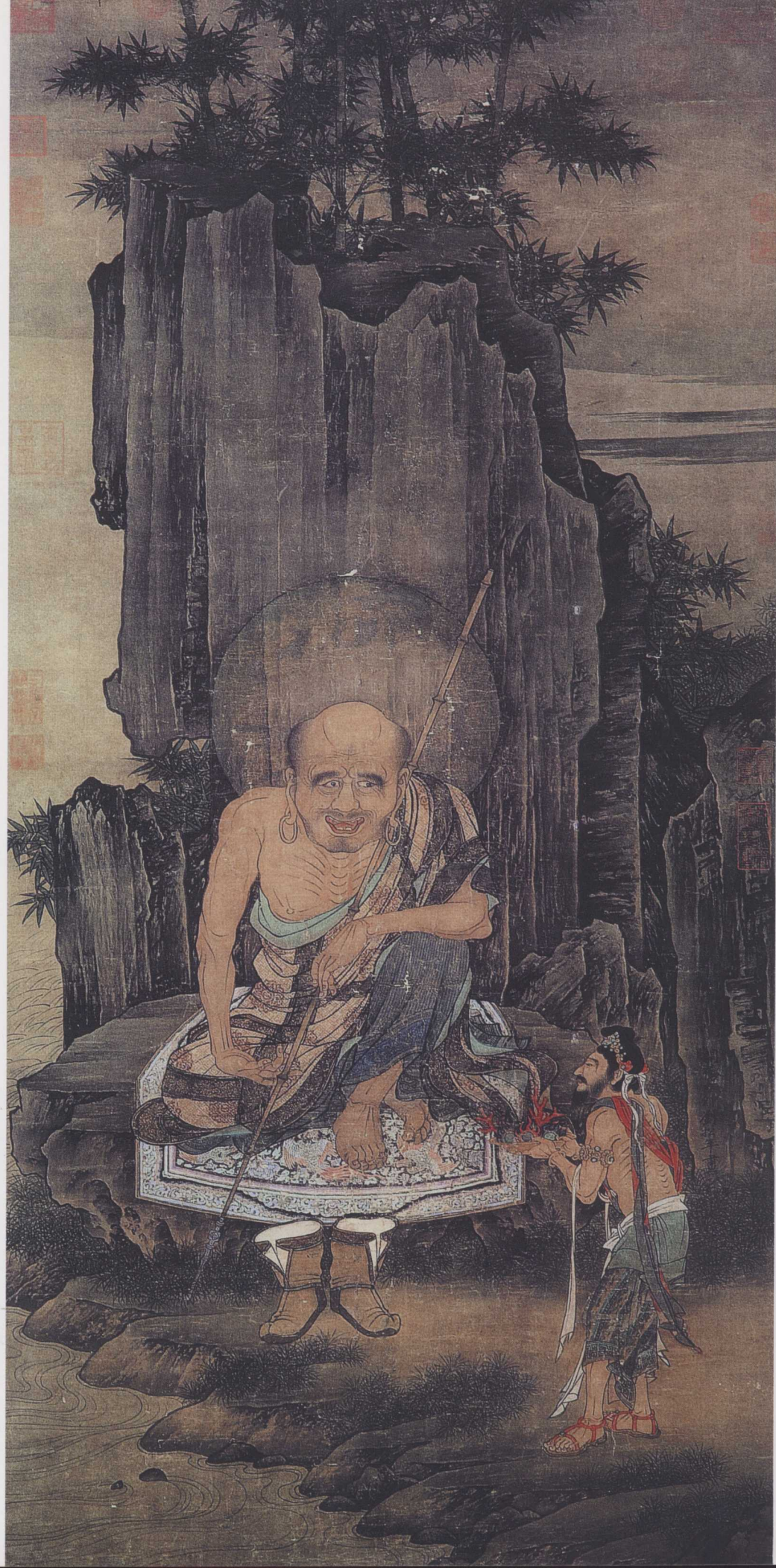
南宋 刘松年 罗汉图轴