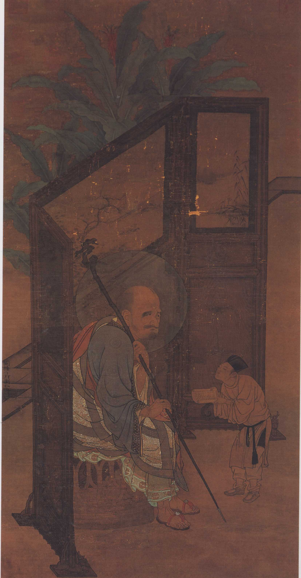
南宋 刘松年 罗汉图轴