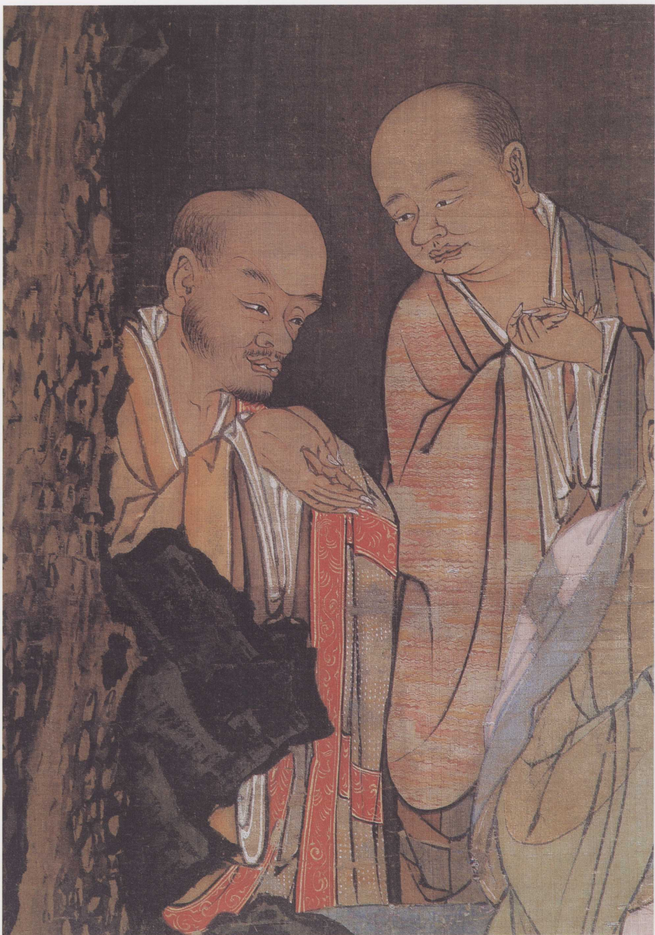
南宋 周季常 五百罗汉图(局部)