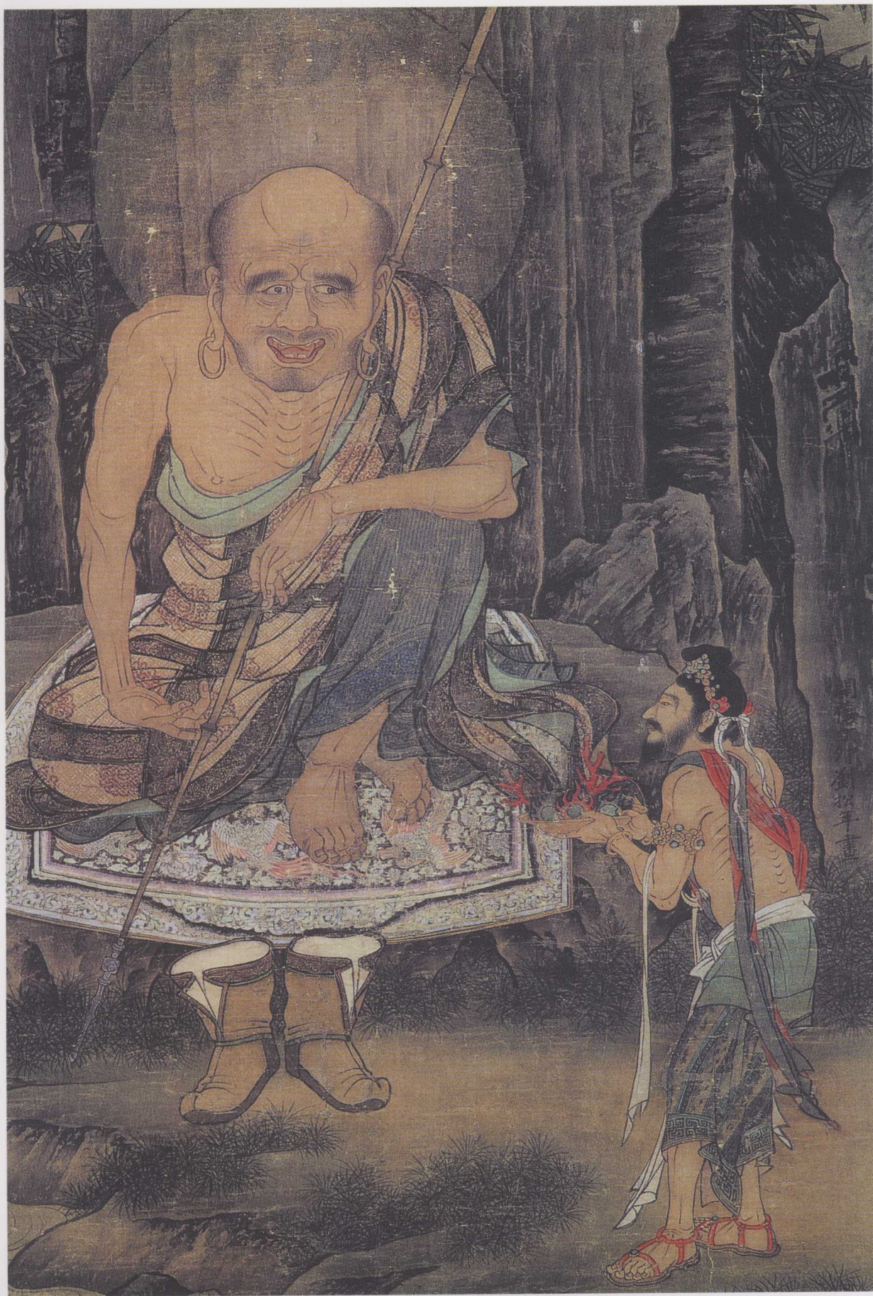
南宋 刘松年 罗汉图轴(局部)