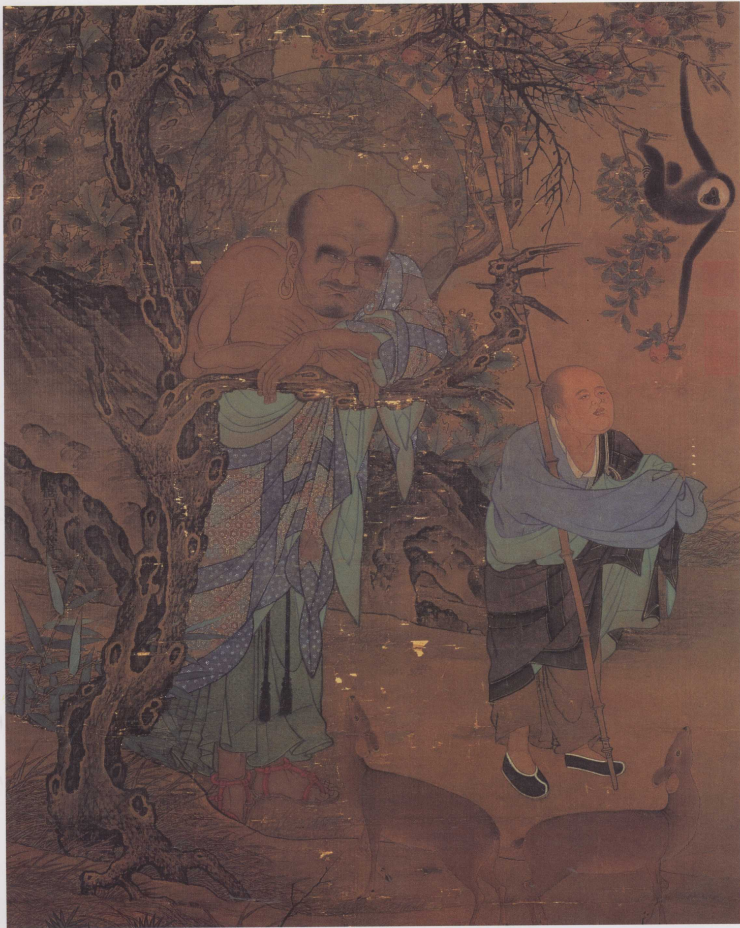
南宋 刘松年 罗汉图轴(局部)