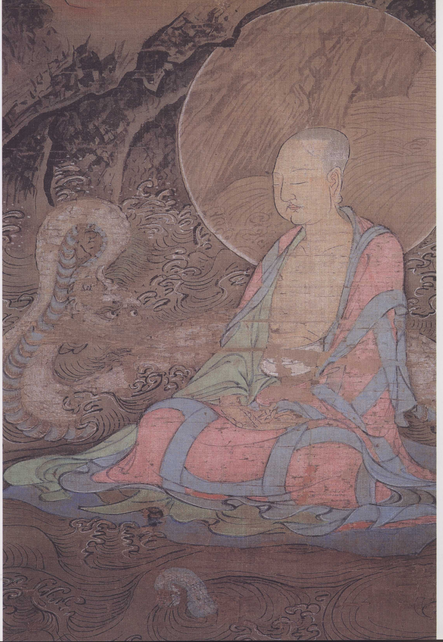
南宋 周季常 五百罗汉图(局部)